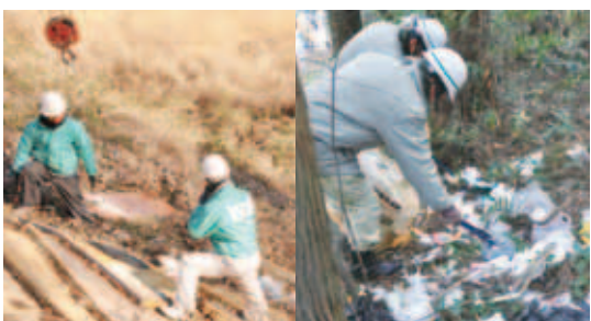
▲熱心に清掃活動を行う災害対策協力会(右)と造園組合

去る1月25日「印西市建設業災害対策協力会」「印西市造園組合」が、竹袋地区、高西新田地区、別所地区でボランティアによる清掃活動を行いました。 「造園組合が清掃活動」は、早朝からごみの投棄が目立っていた道路脇を中心に清掃活動を行い、空き缶やペットボトル、粗大ごみなど約5,130kgものごみが収集されました。 これらは、すべて心ない人によって不法投棄されたもので、決して許される行為ではありません。 市では毎月第1月曜日を「クリーン印西推進デー」とし、まちぐるみでの美化運動を進めると同時に、不法投棄の防止・抑制にも努めています。引き続き、みなさんのご理解とご協力をお願いします。回クリーン推進課クリーン推進班 ☎内線 384。