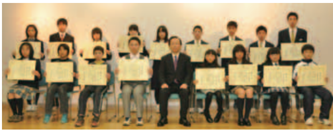
▲各部門で優秀な成績を収めた児童・生徒たちと小野寺教育長(中央)

・保育園や幼稚園などの開始前や終了後、子どもを預かりたり送迎をしたりします。 ・学校の放課後または学童保育などの終了後、子どもを預かったり送迎をしたりします。