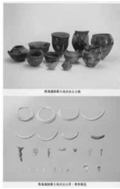
巻頭ページには馬場遺跡出土の遺物や戸ノ内貝塚の遺構写真などがカラーで掲載されています

凡例 曜日時 会場 内容 対象 定員 参加費 申し込み 問い合わせ HPホームページ メールアドレス その他 携帯電話