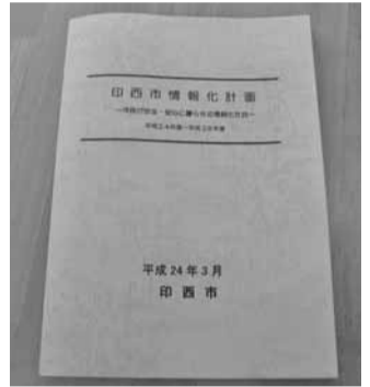
◀「印西市情報化計画」は写真のように冊子にまとめられています

なお、本計画では、毎年度末に各施策・事業の進行状況をチェックし、情報通信技術の進歩や活用範囲の拡大、市民ニーズの変化など、社会情勢の変化も考慮して、必要に応じて計画を見直ししていきます。