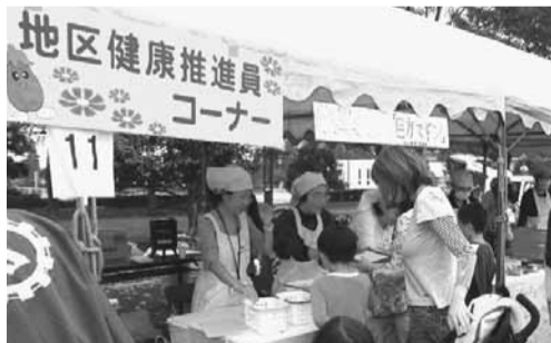
▲地区健康推進員のみなさんは各イベントのほか「広報いんざい」のコラム「元気な食卓」でもおなじみです(写真は昨年の産業まつりの様子)