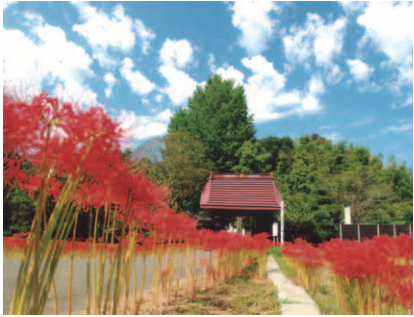
◆佳作 ◆彼岸花と雲 (結縁寺) ◆浪川 進 (茨城県神栖市)

(評) 咲き誇る彼岸花、青空とそこに広がる雲、生い茂る緑のコントラストが素晴らしい。