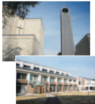
▶高い鐘楼が特徴のチャペル(上)と校舎の外観

北総花の丘公園の南側の長い緑地を歩いて行くと、東側にチャペルが見えてきます。そこがプロテスタント系神学部がある東京基督教大学(内野3-301-5)です。同