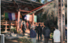
▲このように本堂前の御柱につながっていました