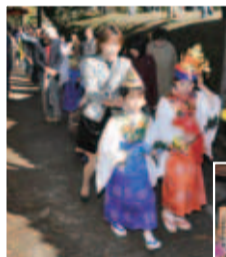
▲稚児行列に参加する親子 ▶本堂で行われた法要の様子