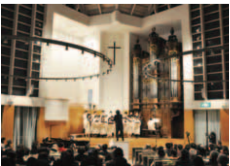
▲コンサートは楽しくも荘厳な雰囲気 同東京基督教大学(☎461131)。

大学は、前身の短大が1989年に東京都から現在の場所に移転。翌年に大学として創立されました。緑溢れるキャンパスには校舎以外にチャペル、国際宣教センター、キリスト教関係の資料が非常に充実した図書館などがあります。特にチャペルは宗教画が描かれたステンドグラスが印象的で、パイプオルガンと 高い天井が生み出す響きに、より、ふくよかな音が奏でられる優れた音楽ホールでもあります。また、敷地内には見事な桜並木もあり、春には「大学の事務局に気軽に一声かけて頂ければ訪れることもかまわない」ということでした。 同大学は全寮制で、生活・信仰・学問が統合されたクリスチャンの育成を目指しています。1学年40人、専任教員1人あたりの学生数は7人という少人数教育で、4人に1人が海外からの留学生です。彼らと共に寮で生活し、学ぶことで文化や言語を超えた交流を経験できるのも特徴です。 わたしたちの多くは、キリスト教徒でなくても12月