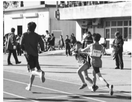
▲たすきを受け継いで走り出す次の走者。あとは任せる!