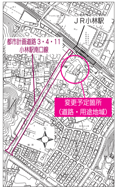
◎都市計画変更予定箇所図◎