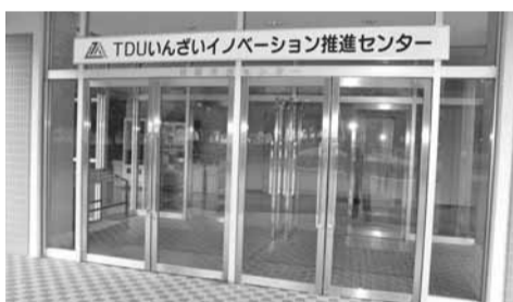
▲TDUいんざいイノベーション推進センターは東京電機大学内にあります

「いんざい産学連携センター」。「NPO法人TDUいんざい産学支援ネットワーク」が行っていた事業を発展的に引き継ぐ形で、現在活動している施設が「TDUいんざいイノベーション推進センター」(以下、同センター)です。