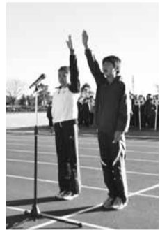
▲元気づく選手宣誓

周回コースには色とりどりの各校のぼり旗が立ち並び、保護者や応援児童が熱い声援を送る中、過去最多となる女子34チーム、男子35チームの選手たちが力走しました。