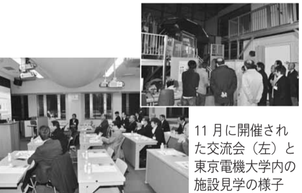
11月に開催された交流会(左)と東京電機大学内の施設見学の様子

「いんざい産学連携センター」。「NPO法人TDUいんざい産学支援ネットワーク」が行っていた事業を発展的に引き継ぐ形で、現在活動している施設が「TDUいんざいイノベーション推進センター」(以下、同センター)です。