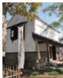
▲「吉岡まちかど博物館」の外観

吉岡まちかど博物館(木下1484)は白壁の土蔵。江戸(明治時代)に、この地に繁栄をもたらした木下河岸と木下街道の繁栄の名残りの品々を伝えている。土蔵そのものも当時この地で河岸問屋・廻漕店を営む界隈きつての豪商・吉岡家が実際に使用していた蔵で明治24年に建造されたものだ。 傷みが酷かったこの土蔵を市民団体の「木下まち育て塾(伊藤哲之会長)」が無償で借り受け、東京電機大学や地域住民の協力を得て修復、平成16年秋に吉岡まちかど博物館として再生した。以来、毎月一回、第一土曜日に一般公開するかわら、23年にシロアリや東日本大震災による被害の修復など本格的なリニューアル工事を行い現在の姿になった。まさに市民手作りの博物館で、木下河岸三社詣出舟之図や山岡鉄舟筆による「銚港丸」の書・写真や銭箱、印半纏などの史料のほか、付属の竹庭には国指定天然記念物「木下貝層」の貝の化石で造られた灯籠、水運の守り神・水天宮の社もあり、訪れる人々にかつての隆盛を謳っている。