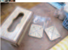
▲高等部の生徒による真心こもった作品

随所にバリアフリーの配慮が見られます。高等部には工芸室・木工室・陶芸室・手芸室などの作業室があり、各々の教室の棚や机上には、さまざまな手作りの作品が沢山保管されていました。これらの作品は、同校で毎年10月に開催する「いんば祭り」やよしきりフェアでも販売されています。また、