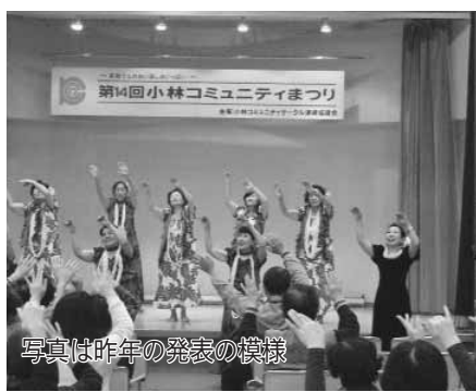
写真は昨年の発表の模様

企画政策課企画政策班(☎内線473・kikakuka@city.inzai.lg.jp)。