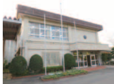
▲閑静な住宅街に隣接する印旛特別支援学校の外観

「印旛特別支援学校」(平賀1160-2)は、県立の学校です。訪問した時は下校時間で、生徒はスクールバスや家族の車などで帰宅する時間帯