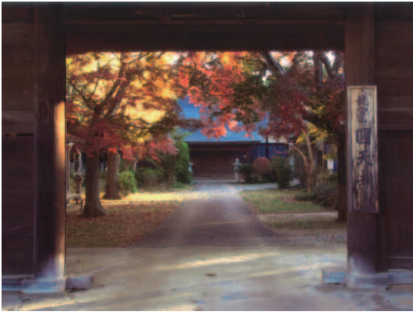
◆佳作 ◆秋彩の寺 (山田【圓天寺】) ◆菊地善則 (佐倉市)