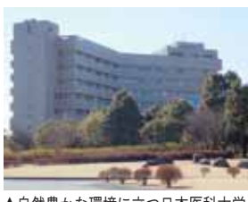
▲自然豊かな環境に立つ日本医科大学千葉北総病院

つ、地域の中核病院を目指す」という基本構想をもとに開院しました。82・5ヘクタールという広大な敷地には水と緑豊かな丘陵が広がっています。 最新医療技術を持つ病院だけでなく、将来的には高齢者の健康保持や増進などを包括した健康・福祉の総合基地の実現を目指しています。現在、許可病床数は600床、診療科目は20を