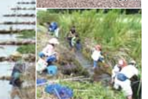
▲亀成川に殖栽されたマコモ(左)と「魚・貝・昆虫などの生き物救出作戦」の様子

しかし、人間の力の前では、今でも暮らしてきた動物は思うように暮らせません。側溝に落ちてしまっただ力エを一日800匹も救出したり、多彩な活動を僕たちが知らない時と場所で行い、僕たちの好きな風景を守り続けているのです。 去る2月9日、イオンホール(イオン千葉ニュータウン店)で開催された同会主催の「奇跡の原っぱそうふけ」のキツネを「守ろう!」にも参加しまし