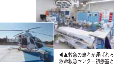
▲救急の患者が運ばれる救命救急センター初療室と常時出勤態勢にあるドクターヘリ(写真左)。共に緊急医療の主力です

つ、地域の中核病院を目指す」という基本構想をもとに開院しました。82・5ヘクタールという広大な敷地には水と緑豊かな丘陵が広がっています。 最新医療技術を持つ病院だけでなく、将来的には高齢者の健康保持や増進などを包括した健康・福祉の総合基地の実現を目指しています。現在、許可病床数は600床、診療科目は20を