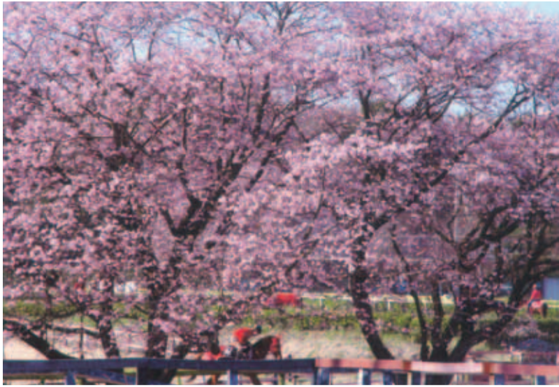
◆佳作 ◆桜の中を (小林牧場) ◆林 一徳 (小林)