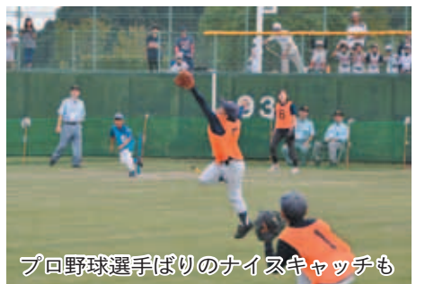
プロ野球選手ばりのナイスキャッチも

「楽しい真剣勝負」がたくさん 大会当日は、市内および近隣からも選抜24チームが出場。4チームずつ6つの会場に分かれ、それぞれ優勝を競いました。各チームには2人まで大人の女性選手が参加。中には、元気な子どもたちに負けじと、大活躍のお母さんの姿も。