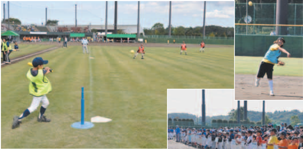
▶開会式にそろった各チームの選手たち