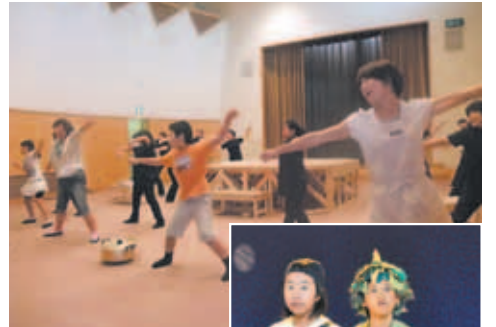
公演直前の練習風景は熱気あふれるものでした