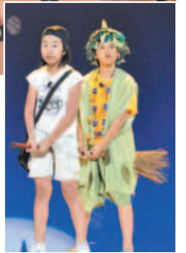
「けやきおに」はけやきの精「けやきおに」と人間たちのふれあいを描いた心温まるミュージカルです