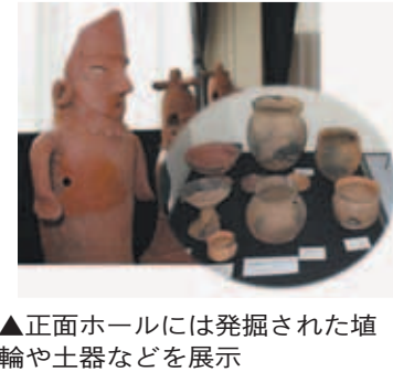
正面ホールには発掘された埴輪や土器などを展示