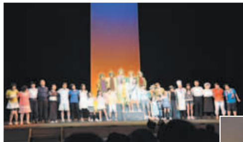
樹齢千年のけやきの木にすむおにと少年を中心に繰り広げられる「絆」をテーマにしたあたたかい作品です。