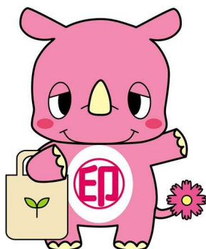
印西市マスコットキャラクター いんざいくん