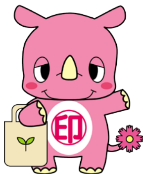
印西市マスコットキャラクター いんざいくん