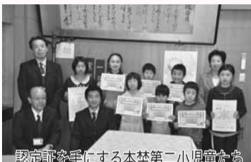
認定証を手にする本塾第二小児童たち

県内で優秀賞に選ばれたのは三校。表彰式では、県教育委員会の浅岡室長から学校・学年代表児童へ優秀賞や認定証が授与され、計画委員会の児童からは、取り組みの内容やその成果についての発表がありました。