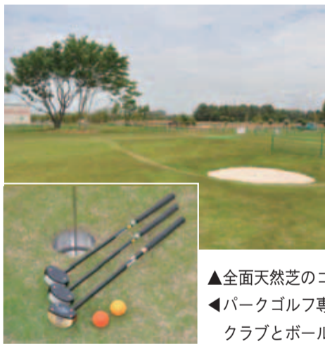
▲全面天然芝のコース ◀パークゴルフ専用のクラブとボール。