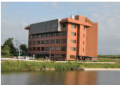
▲中央公民館の外観。朝日に映えるレンガ色の外壁が目印です

利根川のほとり、ちょうど六軒川と弁天川が合流する場所に、きれいなレンガ色をした建物が建っています。一見、ホテルのようにも見えますが、この建物の名前は中央公民館(大森39341)。市内にある公民館の一つです。昭和54年2月に開館し、合併前から印西市の社会教育や生涯学習の拠点として活用されてきました。