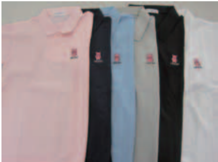
◀カラーは全6色 左胸に「いんざい君」のロゴマークが入ります。