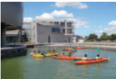
▲主催事業の一つ「ジュニアコース」の宿泊研修(小見川少年自然の家にて)

場所はJR成田線の木下駅から徒歩5分程度。付近には昔ながらの町屋や土蔵があり、古き木下の姿をしのべます。同館の北側にはNPO法人印西市観光協会が主催する「いんざいぶらり川めぐり」の舟の発着所があり、いまの時期は、毎週お客さんがいらっしやいます。また、その発着所から市街地