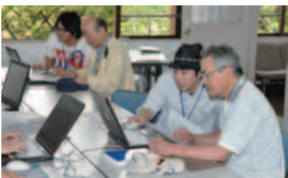
▲「マイペースパソコン塾」では東京電機大学の学生が個別に指導

同館は、文化ホールが無かった時代、成人式や健康診断の会場、さまざまなイベント会場としても役割を担ってきました。現在、市内にある公民館の中では古い部類に入りますが、5階建てのしっかりした作りで、風景も絶景。廊下からは筑波山、季節によっては富士山も見える部屋もあるそうです。