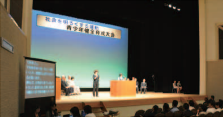
▲▲ 昨年の作文朗読の様子