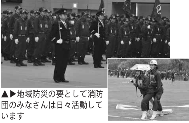
地域防災の要として消防団のみなさんは日々活動しています