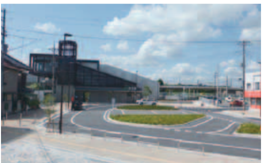
▲広々とした歩道やロータリーが整備された木下駅北口の駅前広場

完成した広場は、歩道を広く確保し、体が不自由な人のための乗降場を設置するなど、利用者に配慮した広場となっています。また、歩道拡幅エリアには、水の流れと地元の祭りをイメージしたデザインブロックが敷設されています。この広場の完成により、駅利用者の安全と利便性の向上が期待されます。 ■建設課建設班 (☎内線 726・727)。