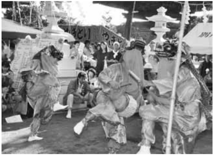
▲獅子たちの軽快な舞をご覧ください

別所の獅子舞は、雄獅子、中獅子、女獅子の三匹の獅子が厄除け地蔵尊に悪疫退散を請願して奉納される別所地区の伝統行事です。夏休みに勇壮な舞をご覧になりませんか。