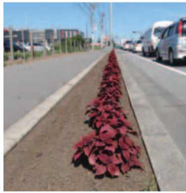
▲コリアス苗約700鉢は、平成24年度の農林水産祭で天皇杯を受賞された(株)ハルディンより無償で提供されました

夏休みに入ると子どもたちが水辺で遊ぶ姿をよく見かけます。水辺には土地改良区などが管理する揚排水機場や水門などがあり、これら付近は水深が深く、水の流れも速いので大変危険です。施設付近で遊んでいる子どもを見かけたら注意してあげてください。 ☎農政課振興班(☎内線 375)。