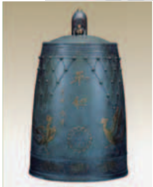
▲重要無形文化財保持者(人間国宝)の故香取正彦氏が作成した「印西平和の鐘」