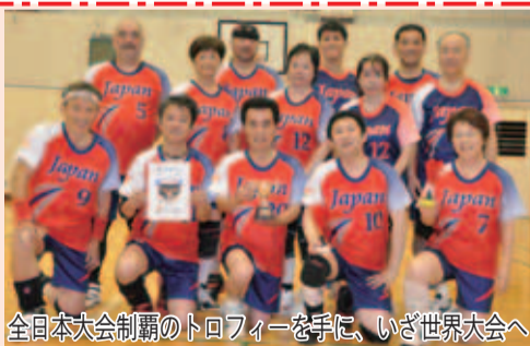
全日本大会制覇のトロフィーを手に、いざ世界大会へ

「チームの特徴は、チームワークの良さ、粘りと気迫です」と語るメンバーのみなさん。練習でも声を掛け合い、活気に満ちた雰囲気でした(右写真下)。