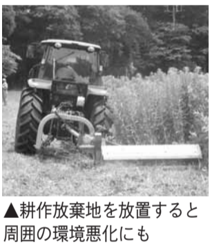
▲耕作放棄地を放置すると周囲の環境悪化にも