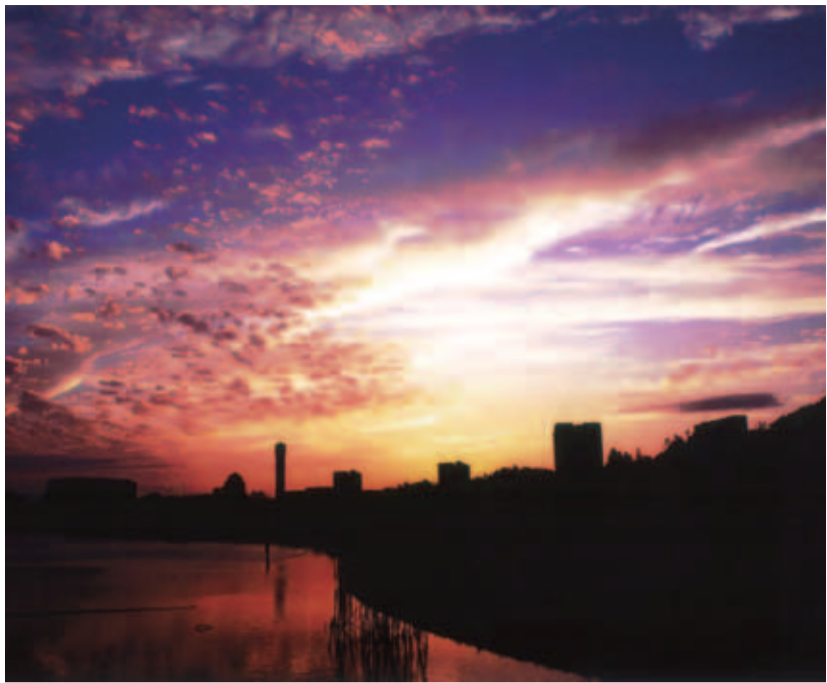
◆佳作 (評) 青色から黄金色にうつりゆく空に、一日の終わりを ◆黄昏時 (北総花の丘公園) 感じさせてくれる作品。 ◆原田 民代 (小倉台)