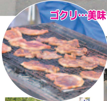
ゴクリ...美味しそう!

が、道は歩いています。これらは、道に捨てられたものや車の窓から捨てられたものがほとんどです。こうした散乱ごみを減らすため、一人ひとりが「自分のごみは自分の手で」という意識を常にもち、決められた場所以外にごみを捨てないことが大切です。 ※詳しくは左記まで。 問 クリーン推進課 法 385)。 法 385)。 法 385)。