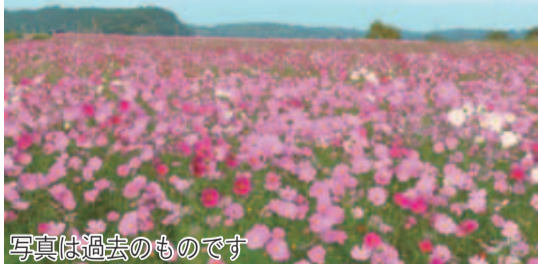
写真は過去のものです

市の花コスモスの畑が、師戸地区(師戸干拓280-1)で見ごろを迎えます。これは地元「師戸寿会」のみなさんの手によるものです。同会は2年前から、市の土地を管理する上で、野原を耕し、コスモス畑の作成を行っていました。 一面に咲くコスモスに、遠方から車で訪れる人もいるほど。印西の秋に彩りをもたらす名所の一つです。