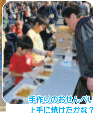
手作りのおせんべい 上手に焼けたかな?

産者自慢の味や技を確かめに来てみませんか。 開 11月2日(土)・午前10時〜午後3時。 場 B1G H O Pカーデンスモール 印西駐車場(原1-2)。 ※下図参照。 問 農政課振興班(☎内線374)。