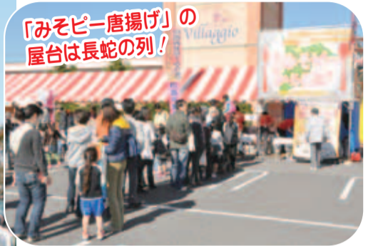
「みそピー唐揚げ」の 屋台は長蛇の列!

「いんざい産業まつり」は、顔の見える販売などを通して生産者と消費者との交流を図り、市で生産される農産物・畜産物・商工業製品などを広く紹介しています。 会場内では、新鮮な野菜や地場産品の販売・飲食物の販売、ふわふわドーム(入場無料)などが行われます。 また、各テントでは、印西の産物も展示・販売されます。生