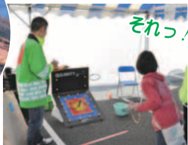
▲▼各テントでは趣向を凝らしたイベントがたくさん!