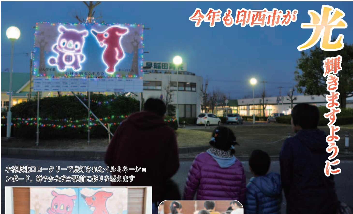
小林駅北口ロータリーで点灯されたイルミネーションボード。鮮やかな光が駅前に彩りを添えます