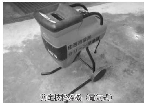
剪定枝粉砕機(電気式)

この見学会は、ごみの減量化や分別の大切さを学ぶため、ごみ処理施設、リサイクル施設など