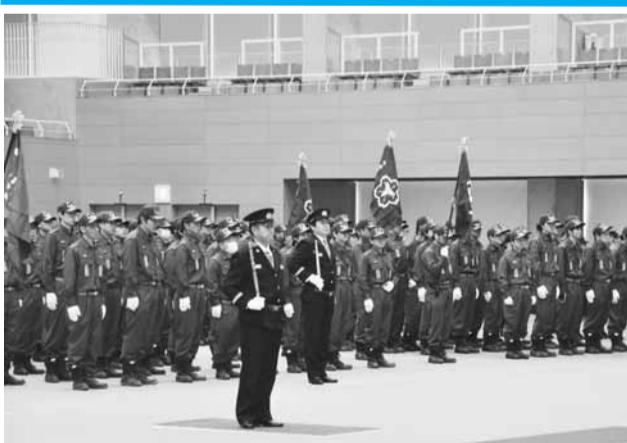
▲市内の全消防団が参加する出初式(写真は昨年のも)

新春にあたり、消防職団員の士気高揚をはかり、職務遂行への決意を新たにすため、次のとおり、平成26年印西市消防出初式を開催します。