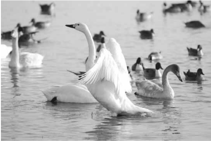
▲ご協力をよろしく申し上げます

凡例 曜日 会場 内容 対象 定員 参加費 申し込み 問い合わせ ホームページ その他 携帯番号