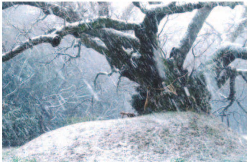
◆佳作 ◆大桜受難 (吉高) ◆田村 雅彦 (酒々井町)