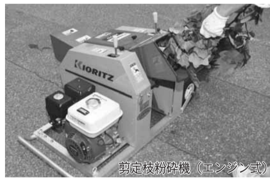
剪定枝粉砕機(エンジン式)