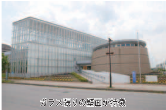
ガラス張りの壁面が特徴

ふれあい文化館(原3-4)は、ガラス張りの壁面や吹き抜けの中庭空間を設け、自然の光をいっぱいに取り入れた