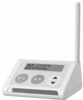
▲みなさんもぜひご利用ください

凡例 時日時 場会場 内容 対象 定員 費参加費 申し込み 問い合わせ HPホームページ メールアドレス その他ほか 携帯電話