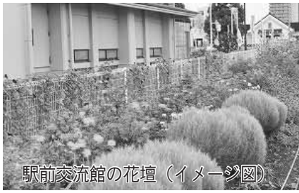
駅前交差館の花壇(イメージ図)