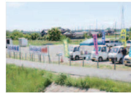
▲賑わいを見せる寄港地「川の停車場」

北総地域では船橋と肩を並べる賑やかさであったと、案内人はまちの歴史を名調子で語ります。舟は弁天橋、JR成田線の鉄橋、弁天大橋を抜け、六軒川との合流地点へ。ここから手賀川となり、気持ちの良い広さの風景の中を下手賀沼方面に向かいます。水面にはカワウやカイツブリ、川辺の葦のしげみや穂先に水鳥がさえずって賑やかです。さらに進んでいくと、真っ白なコブハクチョウが先導するように舟の先を泳いで行きます。70羽を超えるコブハクチョウが、川のあちこちに巣作りをしている季節でした。コブハクチョウの姿を見るところを帰路に着く時刻です。