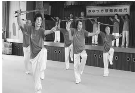
▲活動の成果を熱演(写真は過去のもの)

中央公民館利用サークル懇談会主催「みなつき祭」の季節がやってきました。サークルの活動内容により催し(体験)、発表、