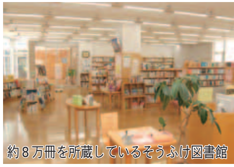
約8万冊を所蔵しているそうふけ図書館

また、児童館は、遊びを通して児童の健康を増進し、情操を豊かにすることを目的に活動。0歳から就学前の子と保護者を対象に、気軽に遊び、交流を図ることが出来る場として「こぎつねコンタの広場」や近隣の小学生以上を対象に「わんぱくランド」などで遊び&学び過すことができます。年間約32,000人の利用者があり、取材当日も子どもたちがいっぱいでした。