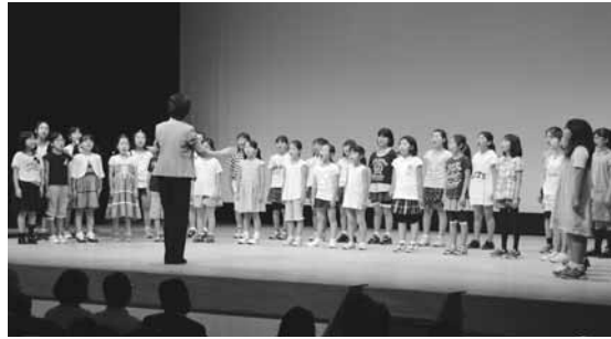
▲育成大会で行われた合唱の様子(写真は過去のもの)

【舞台】原山小学校合唱、木刈中学校吹奏楽、印西ゆめ太鼓の発表。無料。託児コーナーあり。また、会場では手話通訳と要約筆記が行われます。