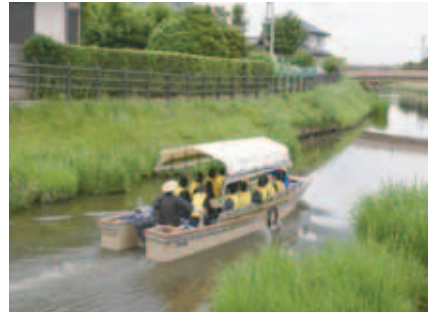
▲のどかな風景を見ながらゆったりと楽しめます

当日は、和船仕立ての小型の舟はほぼ満席で、案内人の乗船についての注意説明の後、早速出船です。近くの手賀排水機場前をゆっくり進み、大森・六軒の町中を巡る弁天川へと向かいます。この弁天川は江戸時代に人の手により開削された「掘割」であり、川沿いにはその昔、製糸工場や染物工場、近郷一の品ぞろえで繁盛した呉服店、料亭や割烹、映画館などが立ち並び、