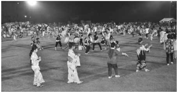
▲にぎやかな「印旛ふるさと祭り」(写真は昨年のももの)