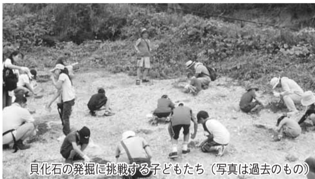
貝化石の発掘に挑戦する子どもたち(写真は過去のもの)