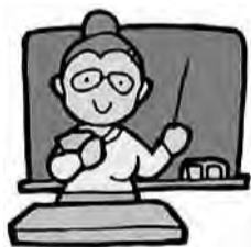
▲もっと知りたい!! 「コレステロールと中性脂肪」