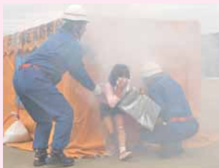
▲総合防災訓練での煙体験の様子

段から道路冠水や浸水を防ぐために側溝などの清掃を行うとともに付近の危険箇所を把握し、テレビ、ラジオなどの気象情報の収集に努めましょう。