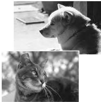
▲犬・猫の命が失われないために

※マイクロチップを同時装着する場合は、抽選時優遇となりますので、手術時に取り止める場合は不妊・去勢手術自体の当選も無効になります。