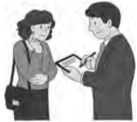
▲調査にご協力ください。

なお、個人情報については、民生委員法(第15条)により、守秘義務が規定されています。 ☎内線255)。