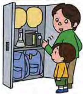
▼非常持出袋や非常備蓄品の置き場所は、常に確認しておく