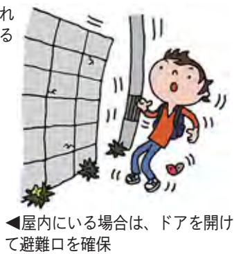
▼屋内にいる場合は、ドアを開けて避難口を確保

▼足元の割れたガラスに注意。慌てて戸外に飛び出さない。▼就寝中は枕や布団などで、頭