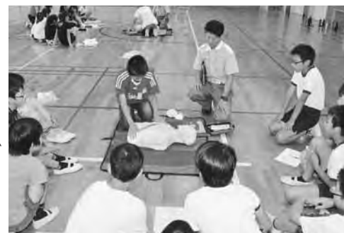
AEDによる応急手当を学ぶ様子

去る6月27日、印西地区消防組合指導の下、市内で初となる、小学生を対象にした救命入門コースを小林北小学校で6年生を対象に開催しました。救命入門コースとは、小学校中高学年(おおむね10歳)以上を対象とし、心肺蘇生法とAED(自動体外式除細動器)による救命に必要な応急手当を学びます。