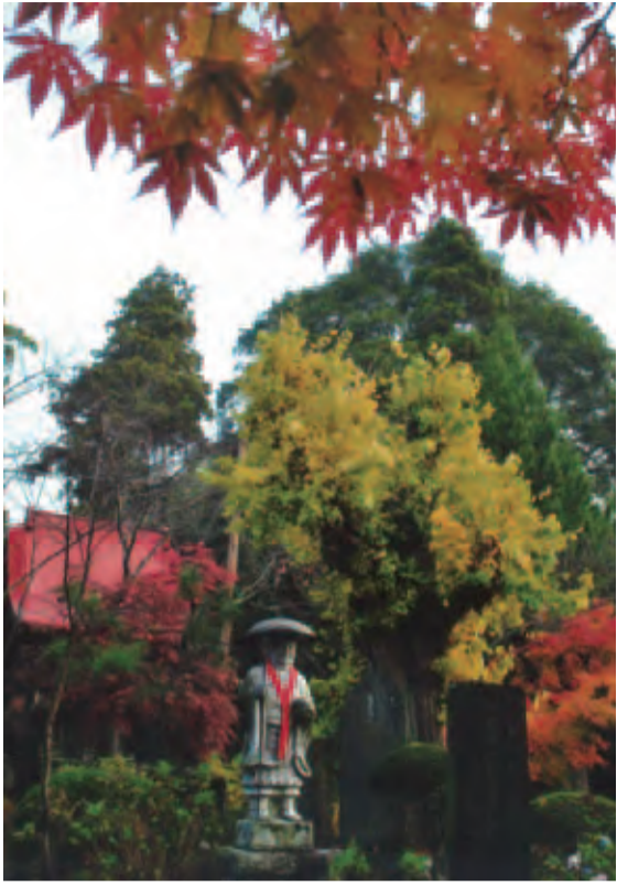
◆優秀賞 ◆秋色の松虫寺(松虫) ◆清水順一(栄町)