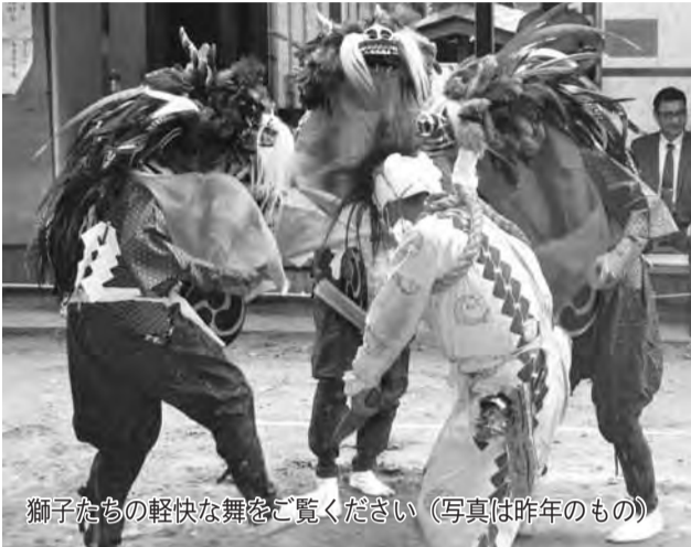
獅子たちの軽快な舞をご覧ください(写真は昨年のももの)

いなざき獅子舞は、秋の豊作への感謝と子孫繁栄の願いが込められ、和泉の鳥見神社へ奉納されます。三匹獅子と道化の舞をぜひ一度ご覧ください。 時 9月23日(祝)・午後2時～。 場 和泉鳥見神社(和泉622番地)。 開 生涯学習課文化班(☎内線546)。