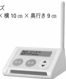
▲みなさんもぜひご利用ください