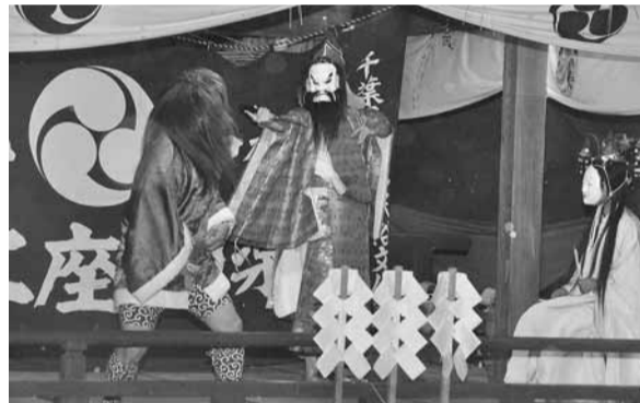
▲浦部の神楽(写真は昨年のもので)