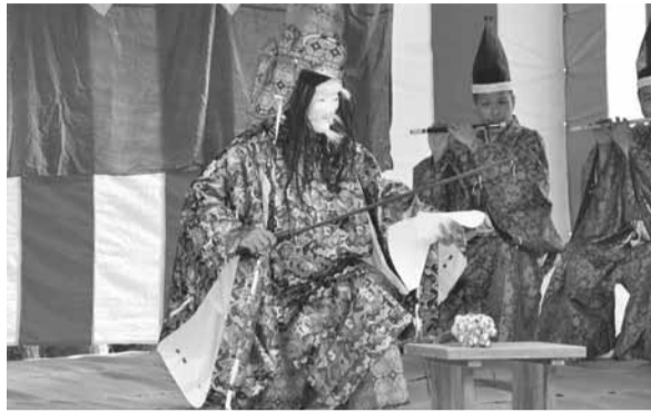
▲鳥見神社の神楽(写真は昨年のもので)