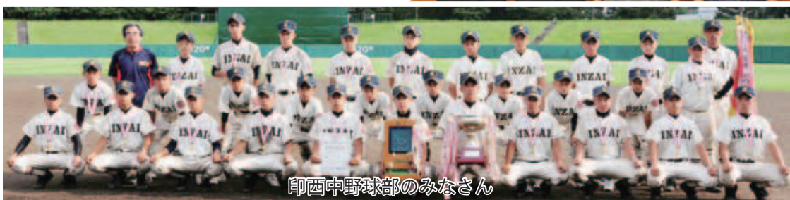
印西中野球部のみなさん