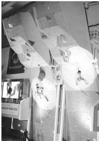
▲自分の限界にチャレンジ