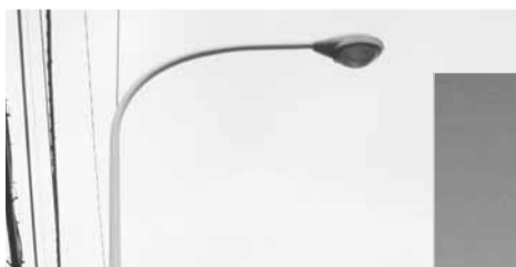
▲このような灯具は道路照明です、道路管理者に連絡ください