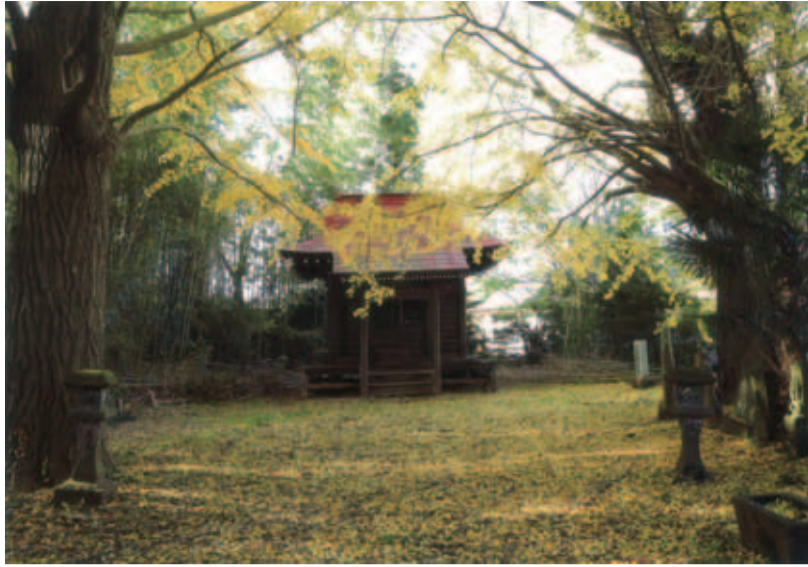
◆優秀賞 (評) 銀杏の葉が、まるで黄色い絨毯を敷いたような色鮮やかな作品。 ◆秋の観音堂 (草深) ◆太田克己 (木下東)