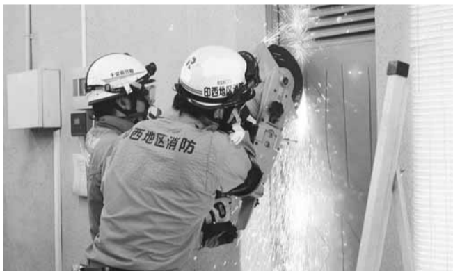
▲エンジンカッターを使用した災害訓練