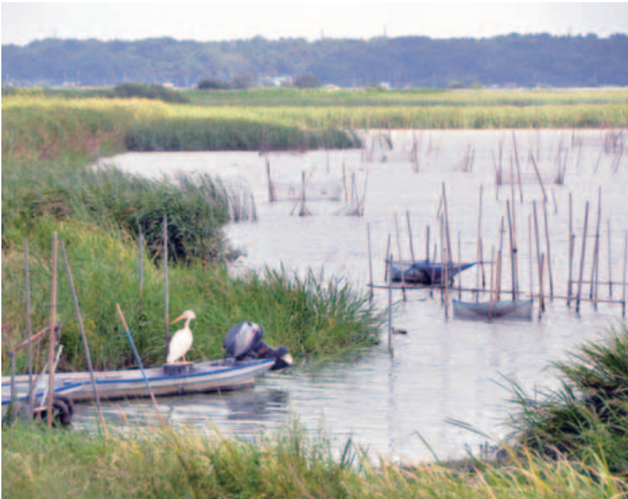
▲印旛沼（吉高）の様子