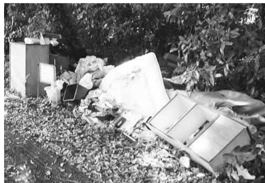
▲山林に捨てられた家庭ごみ