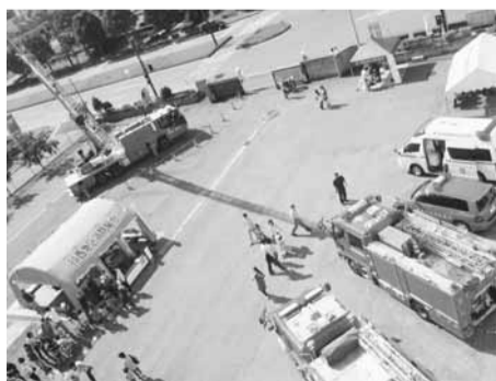
▲▶見て、触って、体験しよう!