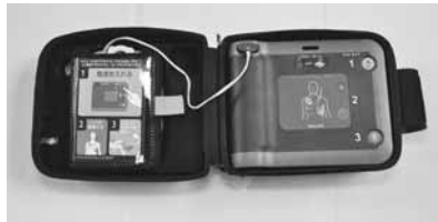
情報提供にご協力ください

印西市産原木シイタケ（露地栽培）は、出荷制限が継続しているため、販売することができません。出荷制限の解除は、市内全域の解除ではなく、解除条件を満たした生産者の一部解除となります。販売を希望する生産者は、生産者台帳に登録が必要となるため、市農政課までご連絡ください。