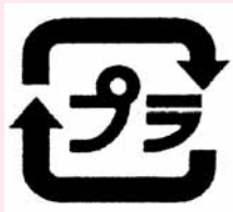
▲表示されているプラマーク

こういったものは、商品の容器や包装ではなくプラマークの表示もありませんので「プラスチック製容器包装」としては出せません。燃やすごみとして青色の指定袋で排出してください。☎クリーン推進課クリーン推進班(☎内線 382)。