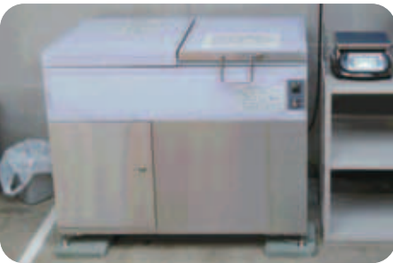
実証実験中の大型生ごみ処理機 幅 98 cm × 奥行 52 cm × 高さ 80 cm

どの街でも、ごみの減量と資源化リサイクルは大きな課題になっています。みなさんも、家庭から出る生ごみでストレスを感じたことがありませんか。ごみ捨ての面倒さ・集積所での力入や猫による被害、さらに夏場はおいのおい問題やハエなどに悩まされる人も多いと思います。