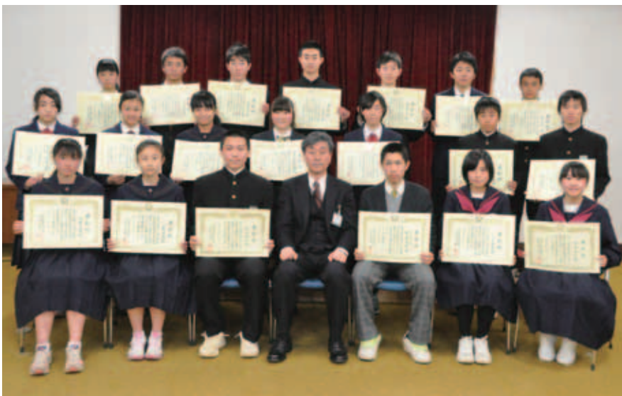
表彰された生徒のみなさんと大木教育長（中央）