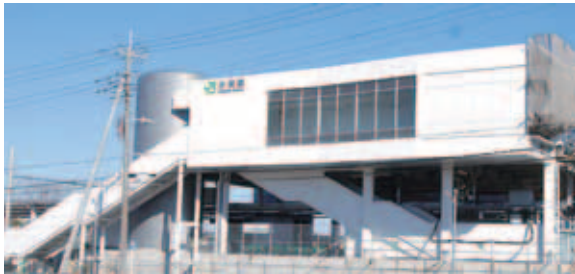
改修工事が進む新駅舎（写真は南口）

主に小林・本埜地区の住民が東京などへの交通機関として利用している JR 成田線小林駅。現在、JR 東日本と市