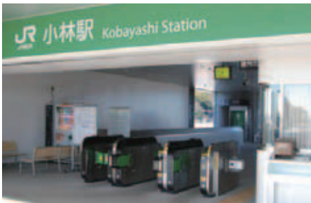
車いす対応の自動改札機

新駅舎は、小林地区の古き良き田園風景と住民の生活に調和した「牧歌的」な駅をコンセプトとし、長年親しんだ地上駅舎から、昨年 11 月に橋上駅舎に生まれ変わりました。