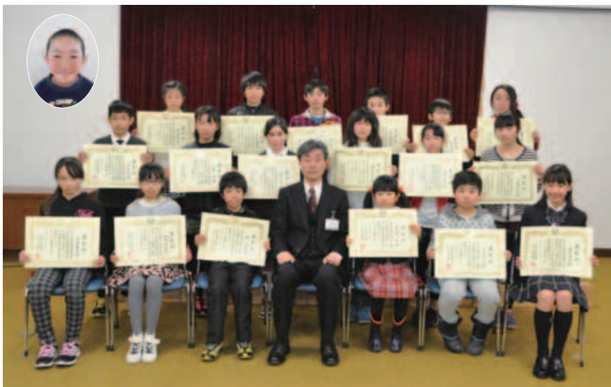
表彰された児童のみなさんと大木教育長（中央）

去る 1 月 30 日、市役所大会議室において、印西市教育委員会児童・生徒表彰が行われました。この表彰は、今年度スポーツの大会や各種コンクールにおいて優秀な成績を収め、功績のあった児童と生徒を表彰するものです。児童・生徒たちは緊張した表情でしたが、大木教育長から表彰状が児童・生徒一人ひとりに手渡されると、受賞した喜びで笑顔がこぼれていました。また、教育長は「今回の表彰は、みなさんの努力の成果です。支えてくれた家族や指導してくれた先生方に感謝し、新たな目標に向かって頑張ってください」と児童・生徒の功績を称えました。(表彰者の氏名などは 3 ページに記載)。