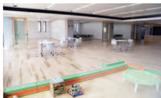
椅子とテーブルのある開放的なギャラリー

●開館時間：午前9時～午後5時 ●休館日：月曜日(国民の休日の場合は、その翌日)と12月28日～1月4日。 ●貸室は、申し込みが必要です。使用日の属する月の2カ月前から牧の原地域交流センターで受