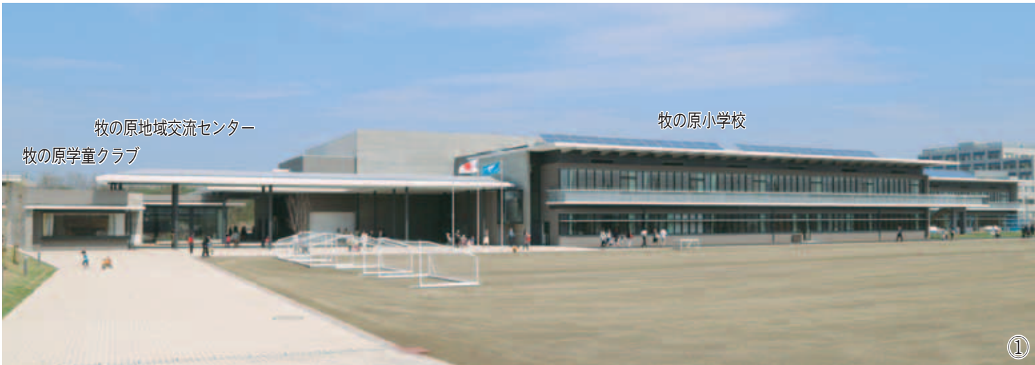
牧の原地域交流センター 牧の原学童クラブ