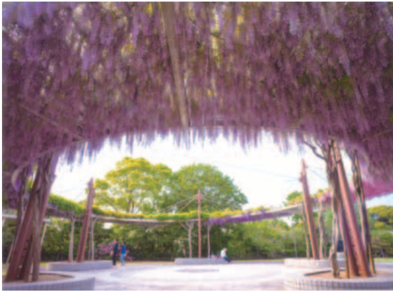
ふるさと大賞 (評) 淡い紫の天蓋が初夏の空に彩りを添えている。差し込む光が花の香りを運んできそうな作品。