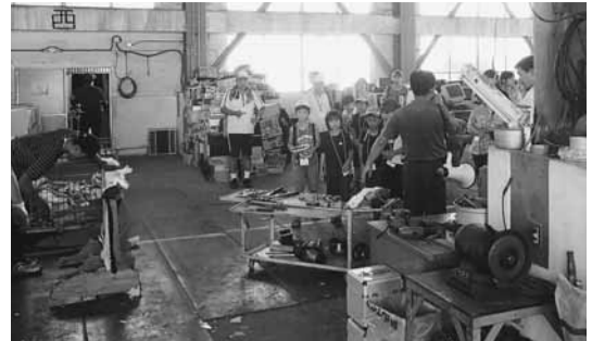
ごみの処理方法を分かりやすく説明します

家庭から出される「ごみ」や「資源物」は、どのように選別され処理されているだろうか。この見学会は、ごみ焼却施設やリサイクル施設などを見学し、ごみ問題や環境について学ぶチャンスです。この機会に、ご家族で参加してみませんか。