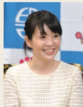
《村田さんの主な作品と受賞歴》

かしてくれました。また、板倉市長から小説家を目指す子どもたちへのアドバイスを求められると「尊敬する映画監督の言葉で『笑われることを恐れない。勇気を出して自分の書いた作品を人に見せること』と答えてくれました。