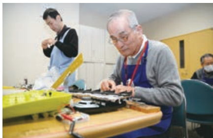
市内の公共施設で修理を受け付けています