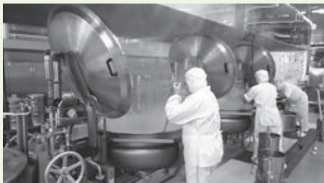
大窯などで心を込めて作ります

現在、市内小中学校の学校給食は5つの給食センター(高花、牧の原、印旛、本埜、滝野)から提供していますが、より安心で安全な給食を届けるため、施設の老朽化対策や衛生管理の向上が求められています。