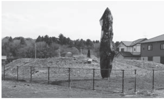
当時の歴史を知る貴重な糸口