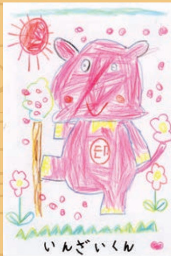
作品名 桜の木の下でお散歩