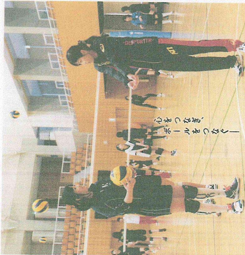
市町協行20周年記念事業 印西バレーボール教室 1月14日、ロンドンオリンピック・バレーボールで日本代表となった竹下桂江さんを指導者に加え、松山下公園総合体育館でバレーボール教室が開催されました。市内中学校のバレーボール部から約90人が参加、基本練習を中心に汗を流しました。「バレーボールは“つなぐ”スポーツです。心をつなぐなくてはなりません。竹下さんの指導に生徒はチームワークと思いやりの大切さも学びました。