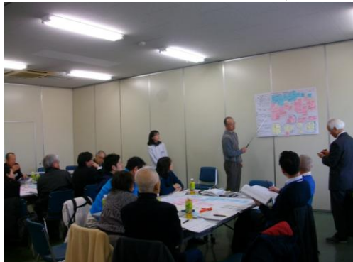
▲ワークショップ代表者発表の様子3 (C班)