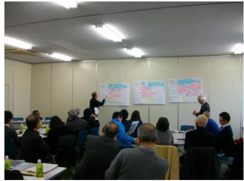
▲ワークショップ代表者発表の様子1 (A班)