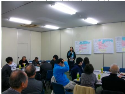
▲策定委員会の斎尾副委員長による講評