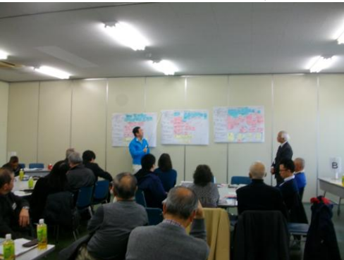
▲ワークショップ代表者発表の様子2 (B班)