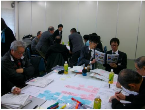
▲ワークショップ意見出しの様子1 (A班)