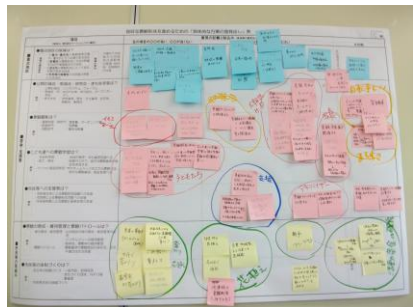
▲ワークショップの各班台紙結果