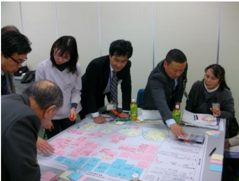
▲ワークショップ意見出しの様子3 (C班)