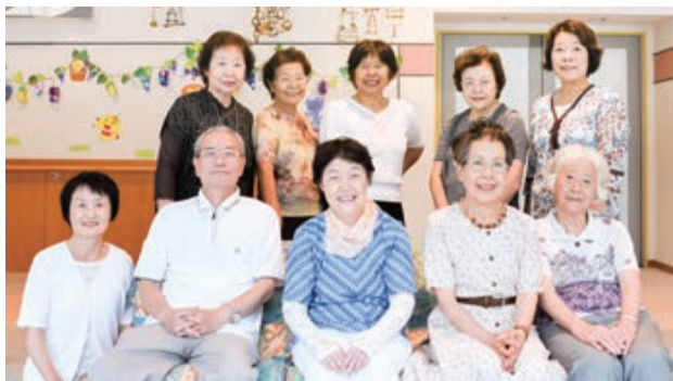
笑顔が似合う会員の皆さん

(評) 晴れ渡った青空を背景に、陽を受けて輝くイチョウが美しい。その下を歩く少女たちの姿をとらえつつ、見上げるようにカメラの視点を設定した撮影者に技量を感じる。