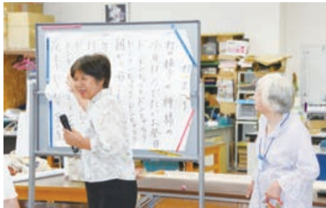
大きくて見やすい手書きの歌詞