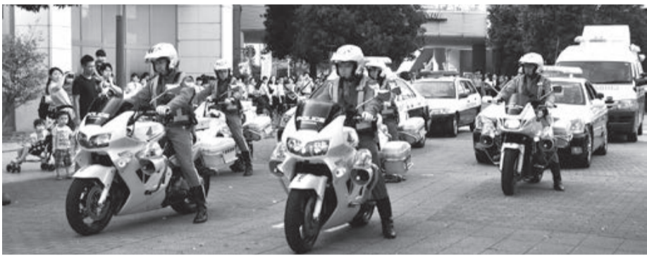
33 4435 市市民安全課市民安全班