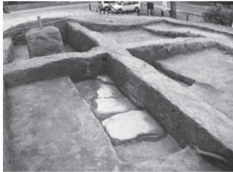
古墳の後円部から出土した石棺