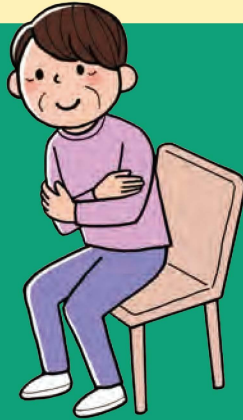
椅子からの立ち上がり