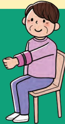
腕を前に上げる運動