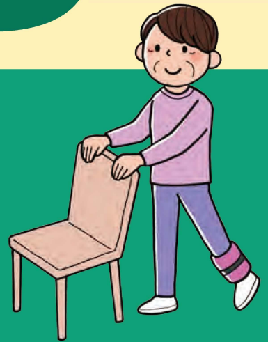
脚の後ろ上げ運動