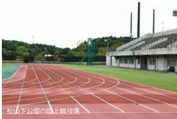
松山下公園の陸上競技場