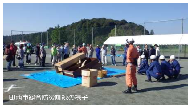
印西市総合防災訓練の様子