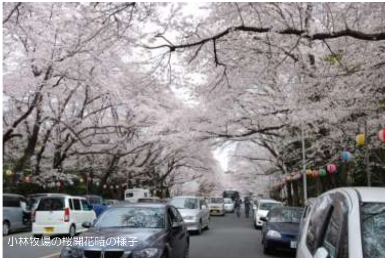
小林牧場の桜開花時の様子