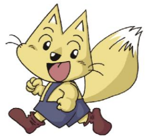
「印西市環境キャラクター エコネ」