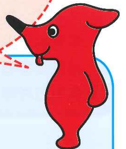
千葉県 マスコットキャラクター チーパくん

方法は、障害種別、状況、考え方によって異なります。 「財布や定期入れに入れておく」 「ケースに入れてカバンの外に取り付ける」等して、 持ち歩きましょう