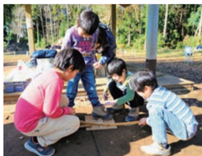
協力して火を起こそう!

市文化財センター職員によって、埴輪の出土位置や立てられた当時の状況などについて詳しく説明が行われ、参加者は間近で出土品を見学することができました。