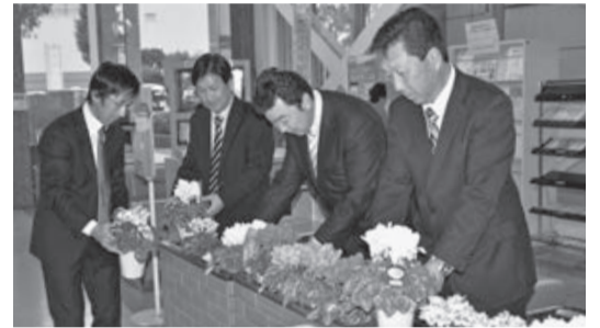
市役所ロビーが色彩やかに

これは、市民の皆さんに花の良さを感じてほしいと、毎年寄贈されているもので、ピンクや赤、白など、色鮮やかな花を付けたシクラメンを市役所ロビーに飾っていただきました。