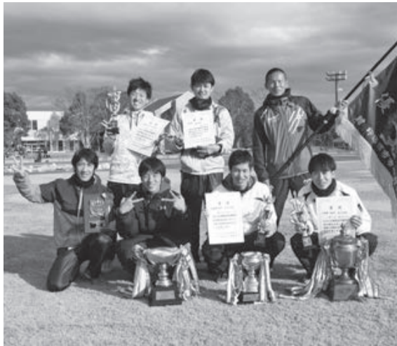
見事連覇を果たした一般の部チーム