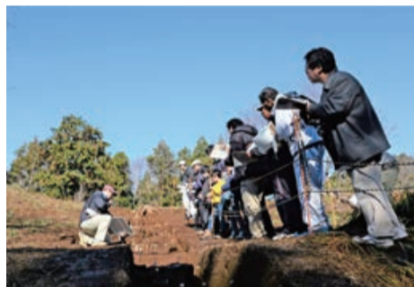
出土した埴輪を近くで見学

12月8日、発掘調査成果の説明会と火起こし体験会が行われました。当日は、普段立ち入り禁止となっている古墳の一部分を開放し、発掘を行った印旛郡