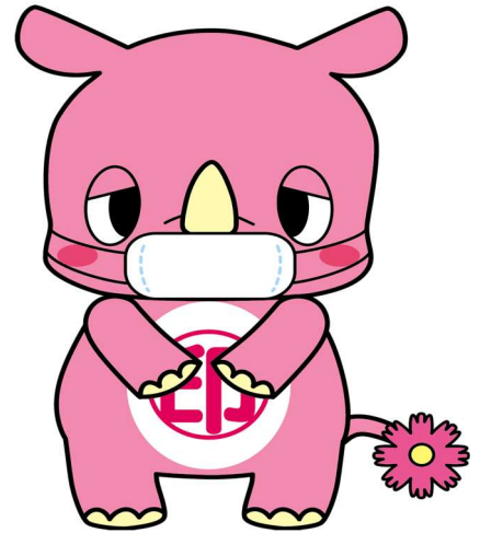
印西市マスコットキャラクター「いんザイ君」