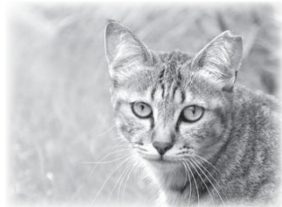
地域の問題として考えよう