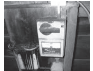
出火した低圧進相コンデンサ(1970年代の製品)