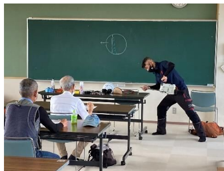
講義：チェーンソーによる伐倒作業の基本