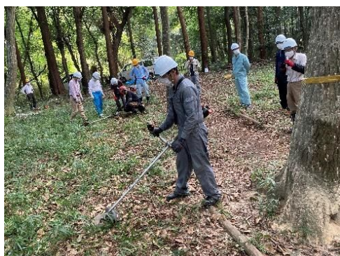
実習：刈払機の安全な下刈作業