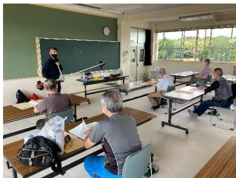
講義：刈払機に関する基本