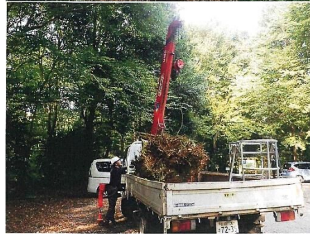
草深の森 ナラの木抜根作業 C=2.0以上 1本