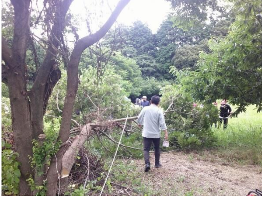
チェーンソーによる伐倒見学