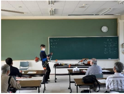
講義：刈払機に関する基本