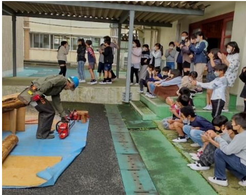
チェーンソー見学①