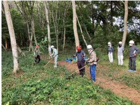
実習：刈払機の安全な下刈作業