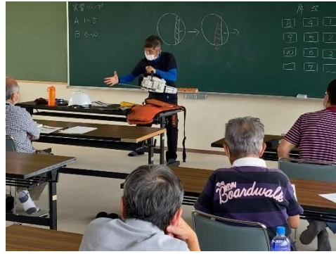
講義：チェーンソーによる伐倒作業の基本