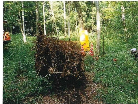
草深の森 ナラの木抜根作業 C=2.0以上 1本