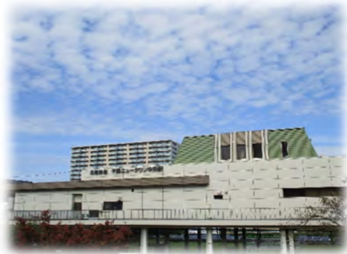
駅圏・都市交流拠点である 千葉ニュータウン中央駅