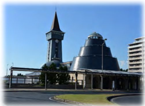
駅圏・都市交流副次拠点である 印旛日本医大駅