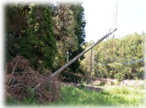
令和元年房総半島台風 (電柱の倒壊・倒木)

本市では、健康増進やユニバーサルデザイン*の考えを取り入れた都市施設の整備などを進め、安全・安心で健康に暮らせる都市づくりを目指します。