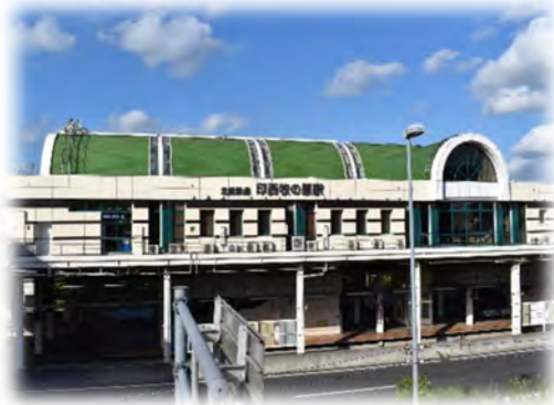
駅圏・都市交流副次拠点である 印西牧の原駅