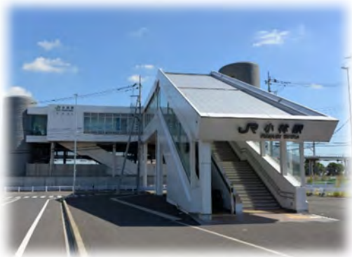
駅圏・都市交流副次拠点である小林駅