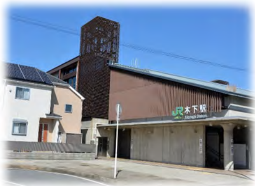
駅圏・都市交流拠点である木下駅