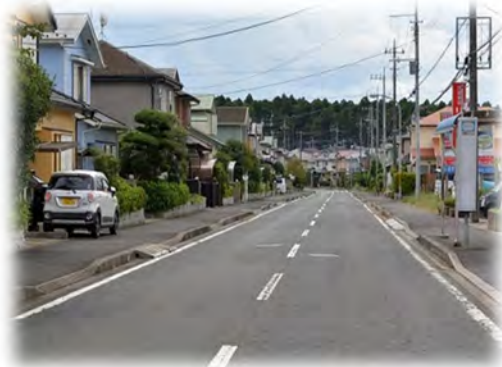
地域拠点である平賀学園台