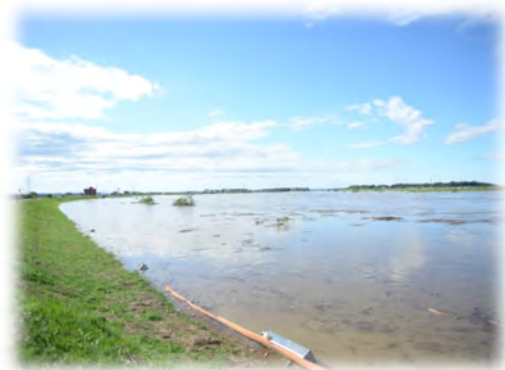
令和元年東日本台風 (印旛沼の水位上昇)