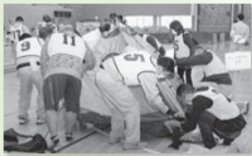
いざというときに備えて防災訓練