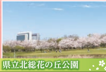
県立北総花の丘公園

場所: 原山1-12-1 千葉ニュータウン中央駅から徒歩10分 駐車場: 約400台(有料)