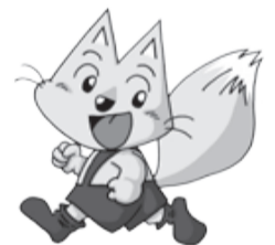
市環境キャラクター エコネ