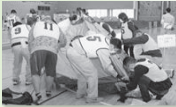
いざというときに備えて防災訓練