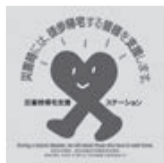
コンビニエンスストアなど