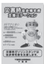
ガソリンスタンド