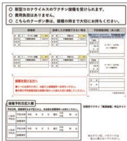
接種券(クーポン)のイメージ