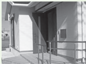
補助制度を活用して整備された集会施設