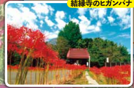
結縁寺のヒガンバナ

千葉ニュータウン地区 1984年(昭和59年)から入居が始まった住宅地で、都市計画に基づく美しい街並みが広がるエリア。大小の商業施設が並び、各種レストランもそろっています。バーベキュー設備などを備えた大型の県立公園もあり、楽しみ方もさまざま。