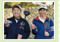
3つのコースのうちSOUTHが一番タフなコースです。