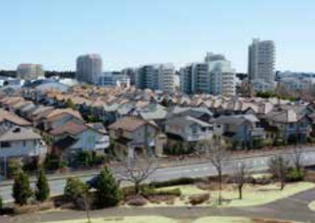
牧の原公園の築山の上から見る住宅街