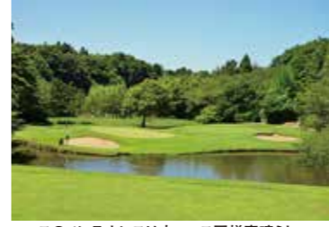
コースのメンテナンスは本コース同様素晴らしい

印旛コースに隣接する変化に富んだ9ホールのコース。適度なアップダウンがあり、池越えのホールなどもある