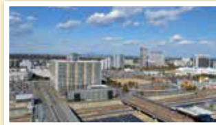
千葉ニュータウン中央駅周辺の景観

明治時代になり明治 34 年 (1901 年) に鉄道 (現 JR 成田線) が開通。周辺の開発が進みます。そして昭和 29 年 (1954 年) に周辺の町や村が合併し印西町が誕生。昭和 42 年 (1967 年) には千葉ニュータウン事業がスタート。昭和 59 年 (1984 年) に北総開発鉄道 (現北総線) が開通し、千葉ニュータウンへの入居が始まりました。印西町は平成 8 年 (1996 年) に市制施行し印西市となり、さらに平成 22 年 (2010 年) に印旛村と本埜村と合併し、現在に至っています。市の人口は平成 30 年 (2018 年) 5 月に 10 万人を突破しました。