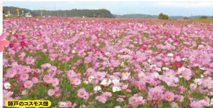
師戸のコスモス畑

所在地 印西市牧の原5丁目1613-1ほか 開花時期 10月初旬～11月中旬 アクセス 北総線「印西牧の原駅」から徒歩約2分 駐車場 あり MAP P.22 D-2