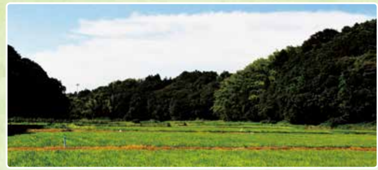
市内各地でこのような里山の風景を見ることができる(上写真は中根地区)