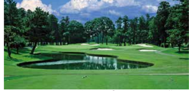
2019年には日本初の米国PGAレギュラーツアー「ZOZOチャンピオンシップ」を開催

コース Info コース数 4コース <キングコース (IN/OUT)> ホール数 18ホール パー数 72 距離 7,011ヤード <クイーンコース (IN/OUT)> ホール数 18ホール パー数 72 距離 6,579ヤード