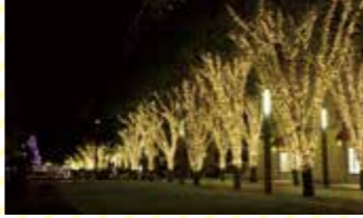
左/印西牧の原駅のすぐ南にある草深公園と高層マンション 右/イルミライ★INZAIのイルミネーション(北総線千葉ニュータウン中央駅北口)