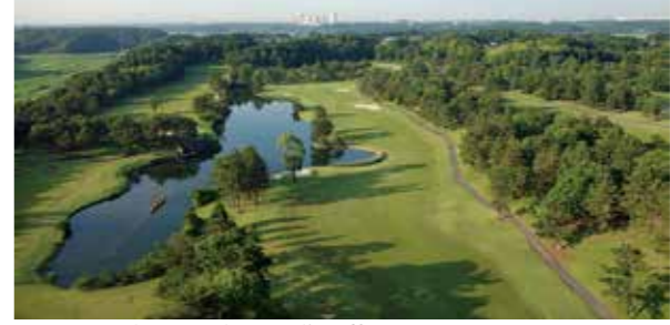
メンテナンスの行き届いた広々とした美しい林間コース

コース Info コース数 3コース (EAST, WEST, SOUTH) ホール数 27ホール パー数 108 距離 10,525ヤード