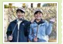
中コースが一番難しく、いつもスコアが出ず苦しんでいます。