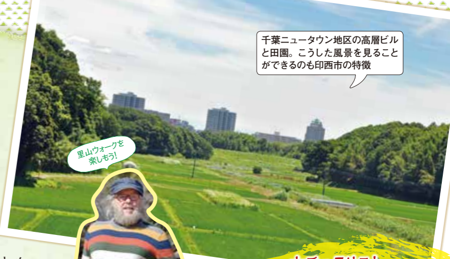
里山ウォークを楽しもう!

千葉ニュータウン地区の高層ビルと田園。こうした風景を見ることが出来るのも印西市の特徴