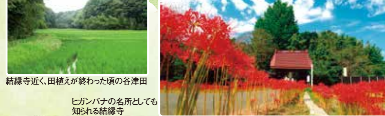
結縁寺近く、田植えが終わった頃の谷津田