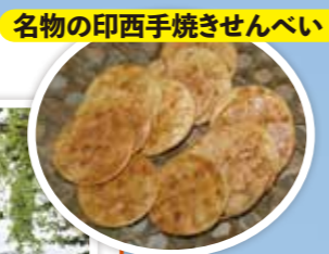
名物の印西手焼きせんべい

木下駅周辺 「木下」と書いて「きおろし」と読みます。その名は江戸時代に利根川水運で材木などの木を卸していたことに由来し、古くから水運の拠点・街道の宿場町として栄えました。周辺には歴史ある寺社や古い屋敷もあり、のどかな船旅を楽しむことができる「いんざいぶらり川めぐり」もあります。