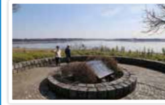
印旛沼は「北印旛沼」「西印旛沼」から成る

印旛沼周辺 千葉県最大の湖沼「印旛沼」周辺には、昔ながらの田園風景が広がっています。また、近隣には公園やサイクリングロード、桜の花見スポットもあり、市内外から多くの人達が訪れるポイントになっています。