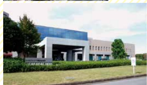
左上/建物に特徴がある印旛日本医大駅 左下/北総エリアで有数の規模を誇る日本医科大学千葉北総病院 右/落ち着いた住宅街が広がる印旛日本医大駅周辺