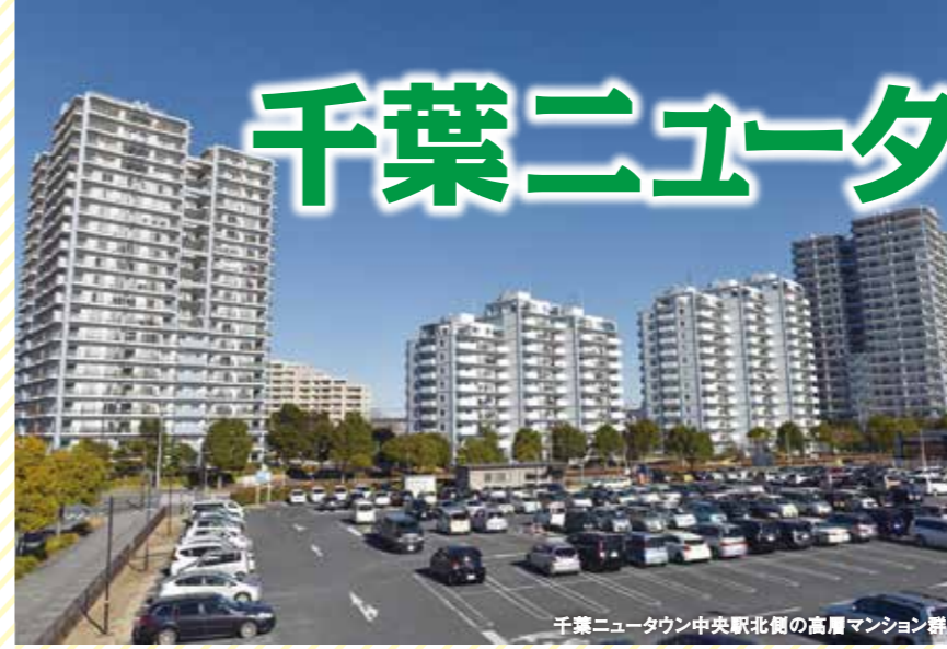
千葉ニュータウン中央駅北側の高層マンション群