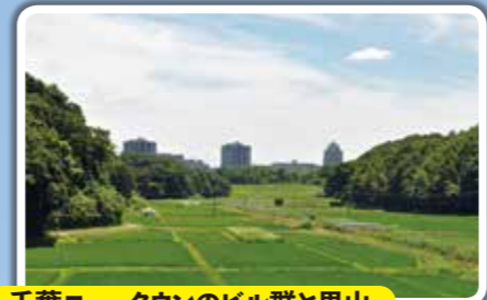
千葉ニュータウンのビル群と里山