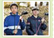
ウォーターハザードの攻略がスコアメイクの鍵になると思います。