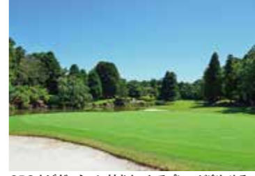
GPSナビゲーション付きカートでプレーが楽しめる

18ホールのフラットな林間コース。豊かな緑とよく手入れされたグリーンが美しい。アメリカのプロツアーのディレクターを長年務めたジャック・タトヒル氏の監修により、どのレベルのプレイヤーも楽しめる、計算されたコースレイアウトになっている。