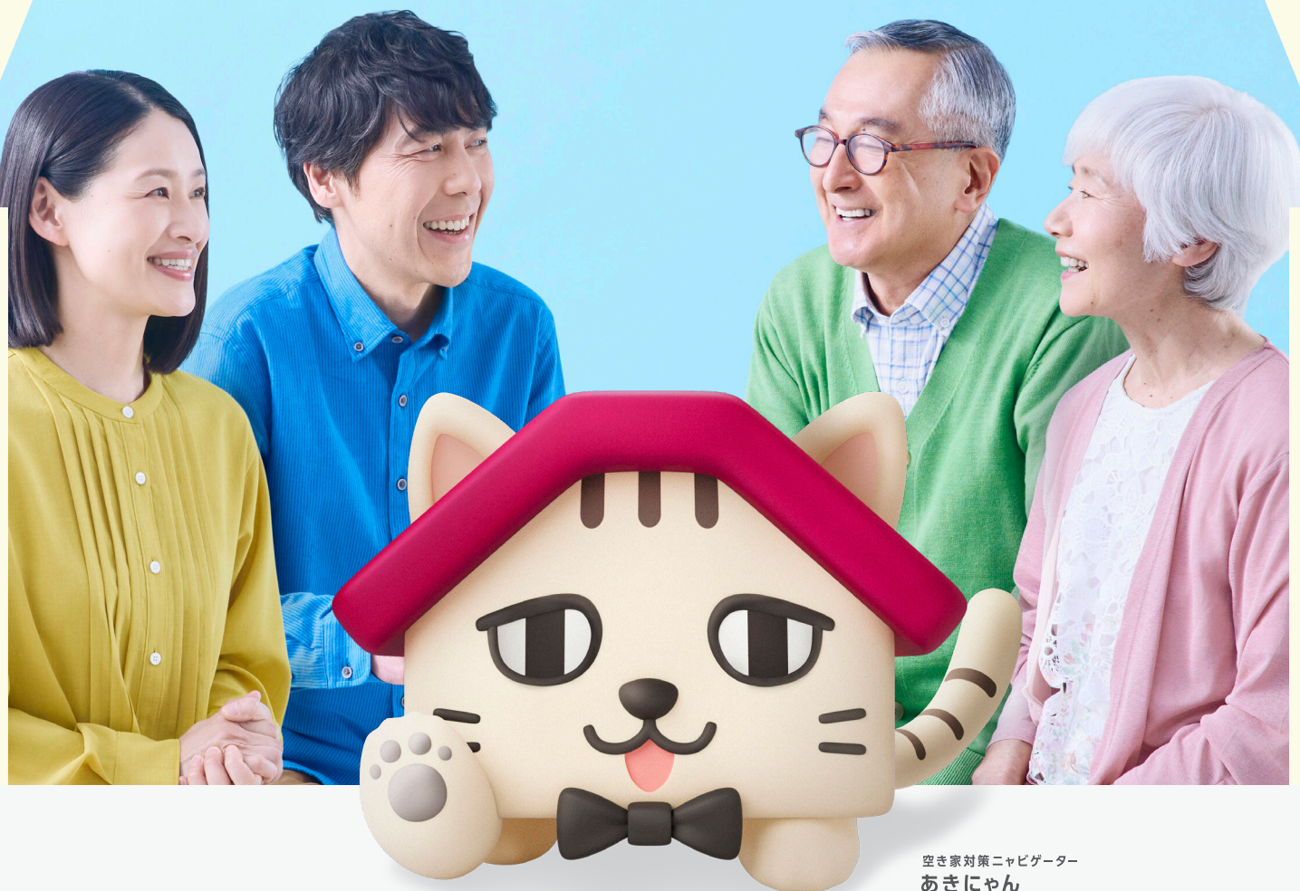
空き家対策キャビゲーター あきにゃん

空き家になると、お金が余分にかかる&ご近所に心配をかけることも。 あなたのお家がそうならないよう、今から手をつけるのが大事ニャ。