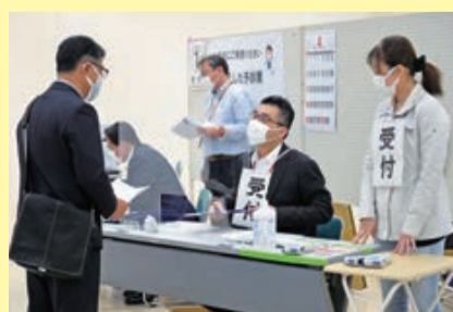
接種券、予診票、本人確認書類などを用意