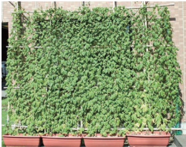
緑が涼感を呼びます

「グリーンカーテン」とは、つる性の植物を育て、窓辺に設置したネットにはわせて作る自然のカーテンのことです。日差しを遮るだけでなく、建物に蓄積される熱の軽減や、葉の蒸散作用により室温を下げる効果があります。