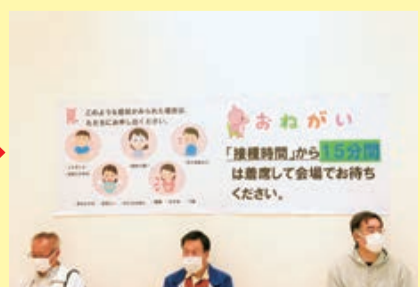
接種後は15分程度待機