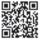
粗大ごみの出し方