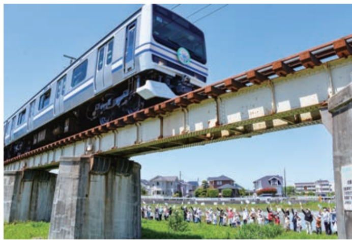
記念列車に手を振る小林北小学校の児童たち