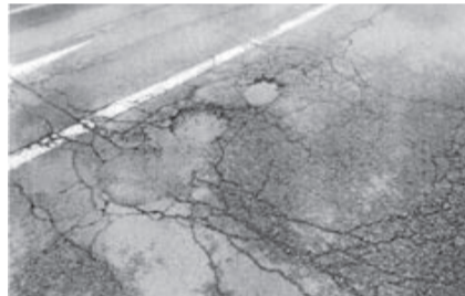
見つけたときは市へ連絡を

また、私有地から車道や歩道に伸びた枝は、車や歩行者の通行の支障となります。所有者は剪定するなど、適正な管理をお願いします。 場土木管理課維持係(☎33-4670)、印旛支所市民サービス課地域支援係(☎98-1117)、本埜支所市民サービス課地域支援係(☎97-1111)