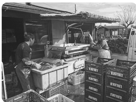
夫婦力を合わせての出荷作業

また、就農してまだ日が浅いため、現在は県農業事務所が行っている「経営体育成セミナー」に参加して、