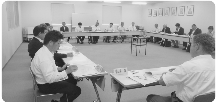
総会において慎重に審議をする農業委員と農地利用最適化推進委員

農業委員会等に関する法律の改正により本市の農業委員会は、平成30年4月1日から新体制に移行しました。 新体制では、これまでと同様の職務を行う農業委員11人のほかに、それぞれの担当区域において活動する農地利用最適化推進委員15人が新たに加わりました。 各委員の主な役割と業務内容は、次のとおりです。