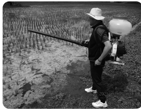
水稲に発生した藻の駆除作業