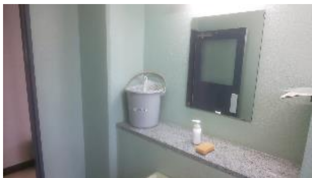
▲男子トイレ洗面台に設置