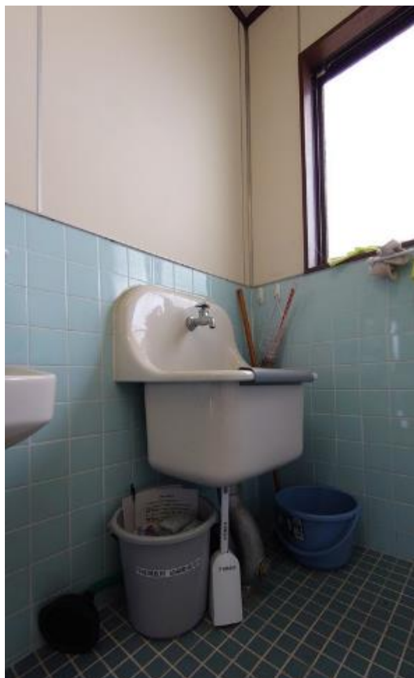
▲男子トイレ内に設置