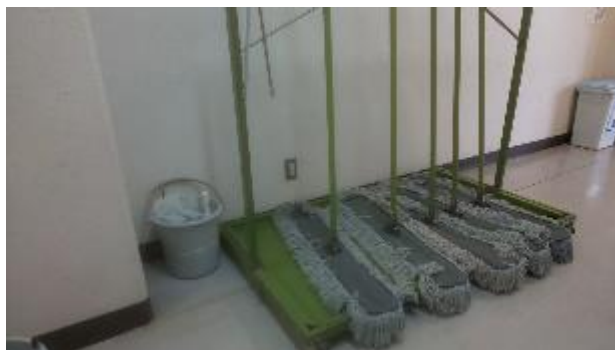
▲トイレ前廊下に設置