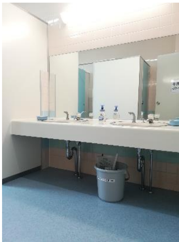
▲男子トイレ手洗い下に設置