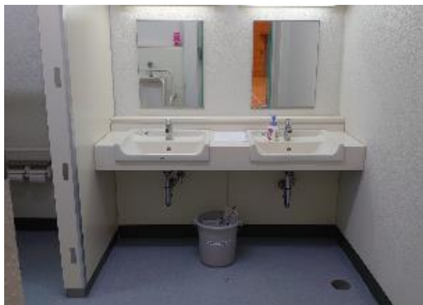
▲男子トイレ手洗い下に設置