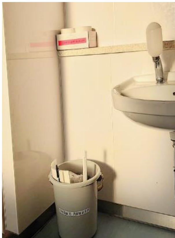
▲女子トイレ内に設置