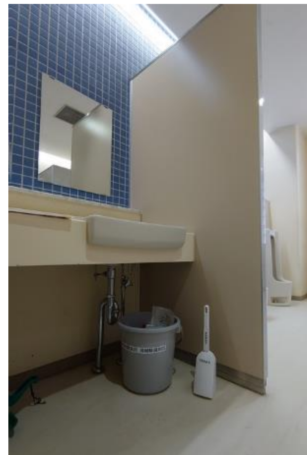
▲男子トイレ手洗い下に設置