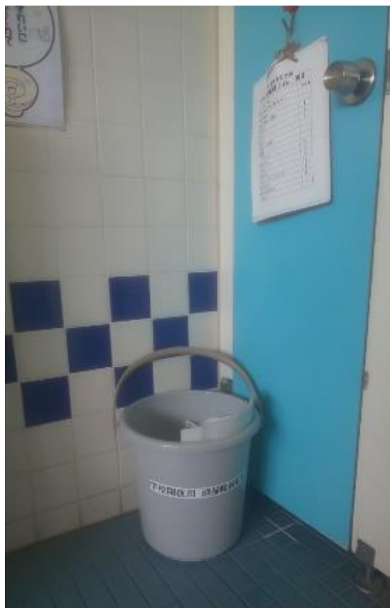
▲男子トイレ用具入れの前に設置