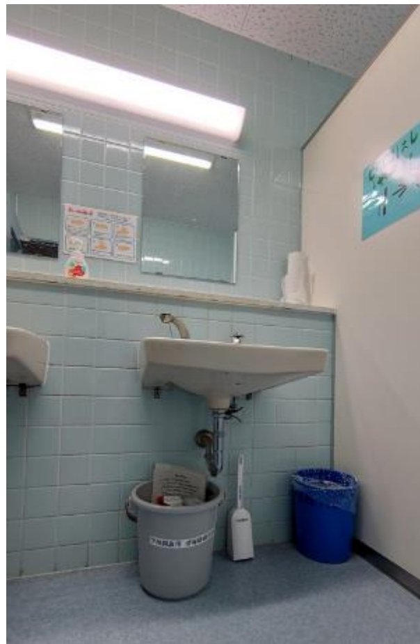
▲男子トイレ手洗い下に設置