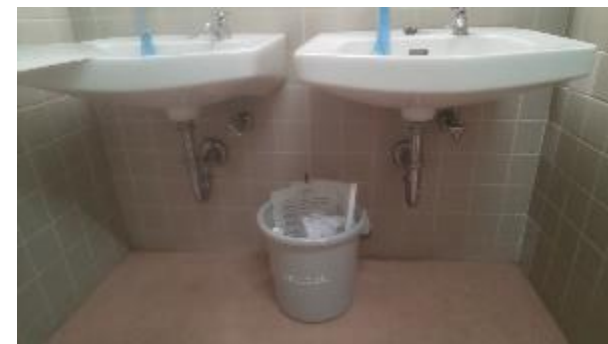
▲女子トイレ手洗い下に設置