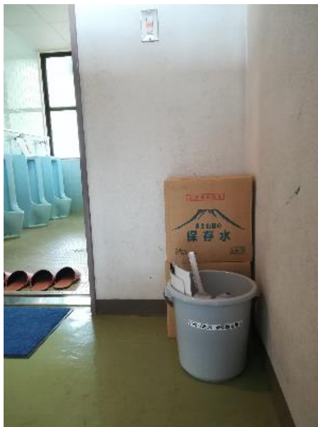
▲男子トイレ前に設置