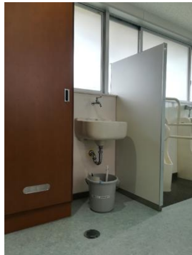
▲男子トイレ内手洗い下に設置