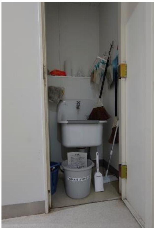
▲女子トイレ入口用具入れに設置