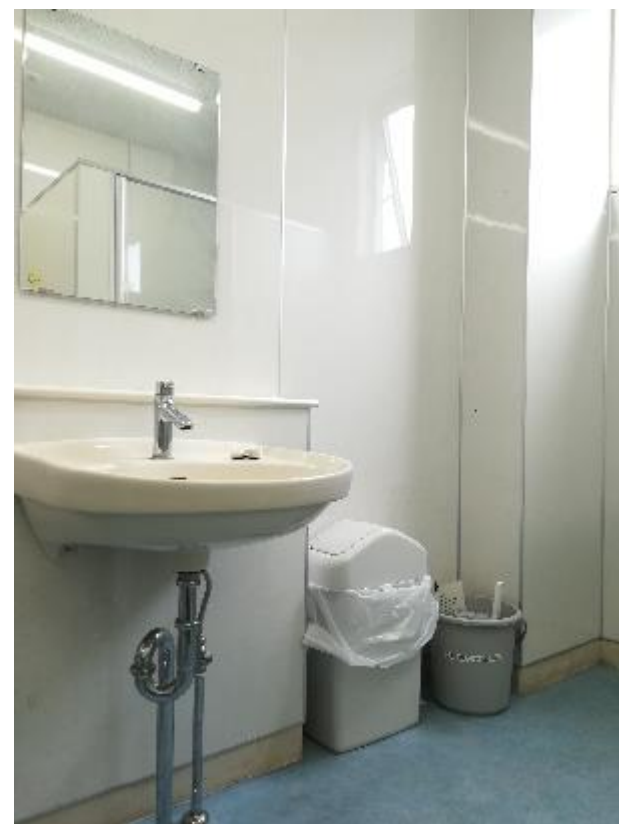
▲男子トイレ内に設置