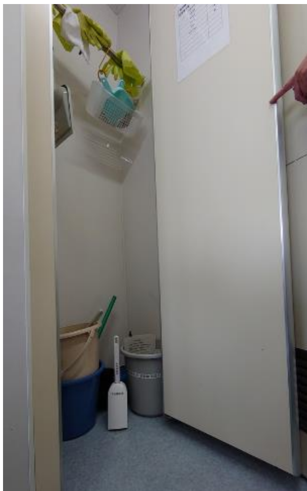
▲男子トイレ用具入れに設置