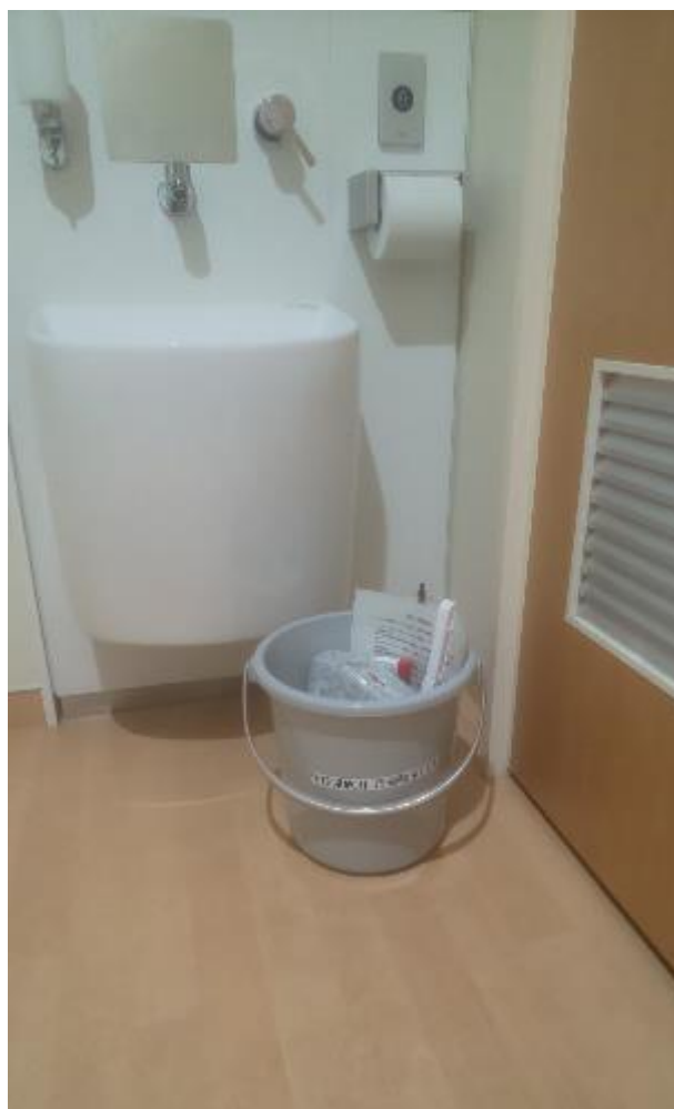
▲多目的トイレ内に設置