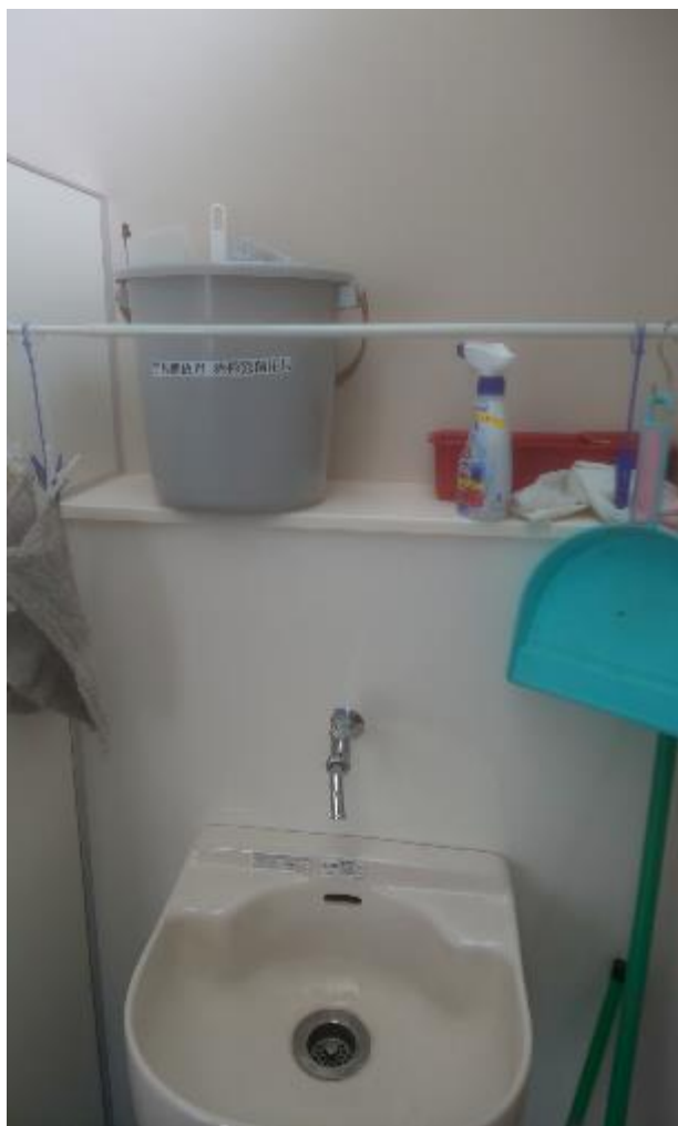
▲男子トイレ内に設置