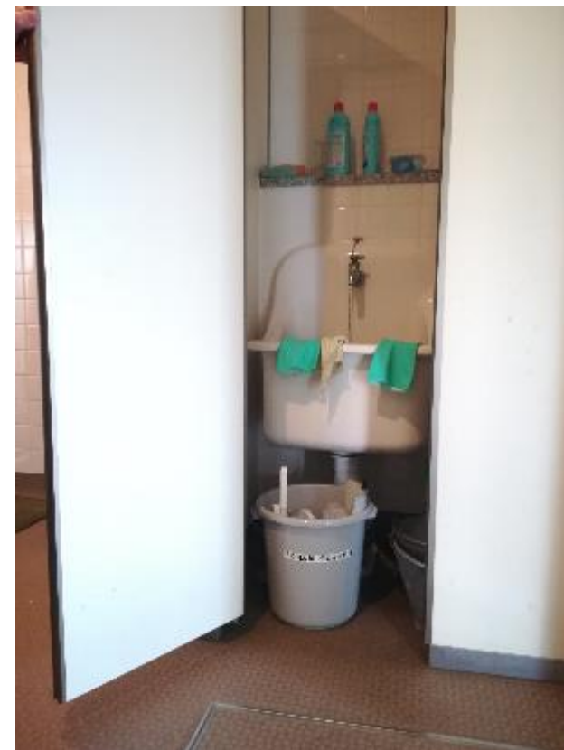
▲トイレ前掃除用具入れに設定