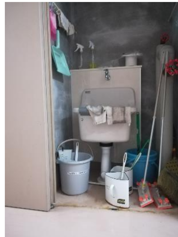
▲男子トイレ内に設置