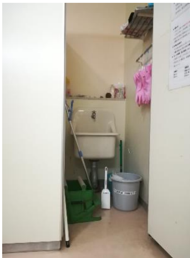
▲女子トイレ内用具入れに設置