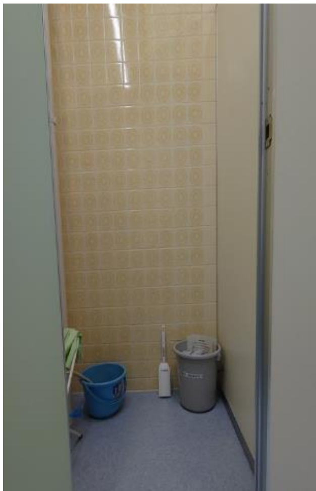
▲男子トイレ内用具入れに設置