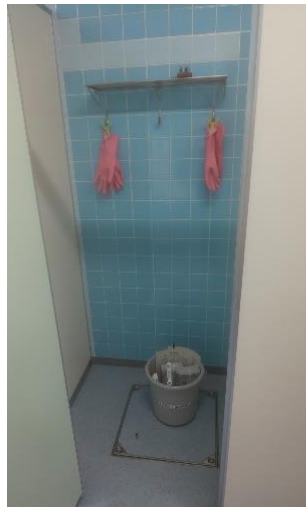
▲男子トイレ内用具入れに設置(右から二つ目の個室)