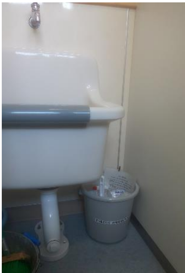
▲男子トイレ掃除用具入れに設置