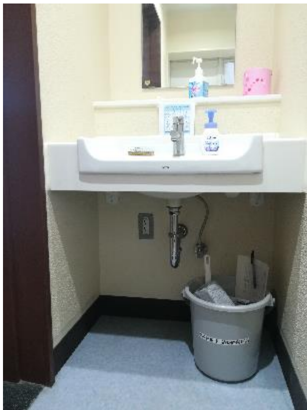
▲男子トイレ内手洗い下に設置