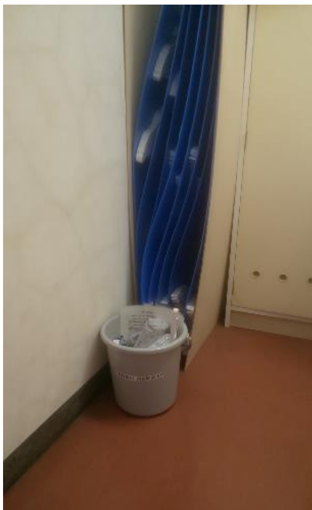
▲男子トイレ内用具室に設置