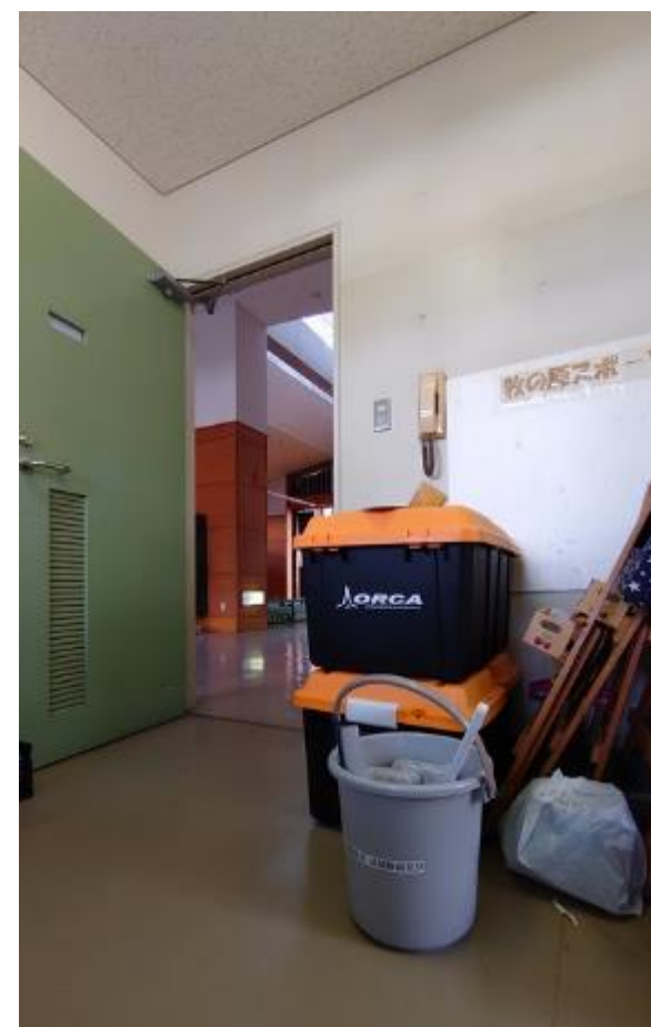
▲体育館管理室に設置