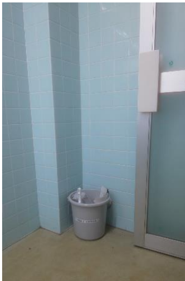
▲男子トイレ内に設置