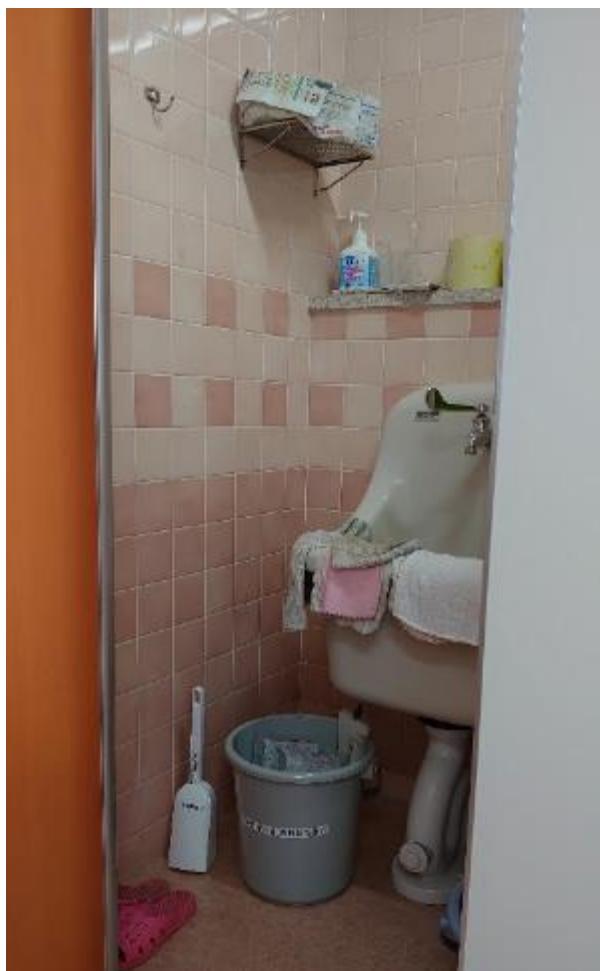
▲女子トイレ内用具入れに設置