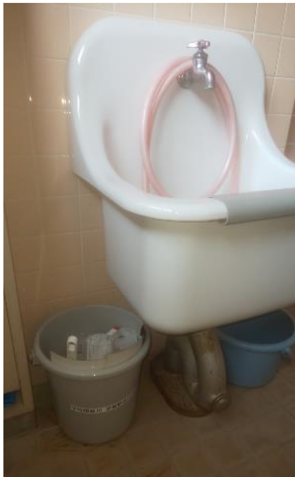
▲女子トイレ内に設置