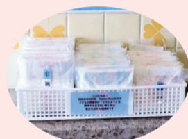
▲各公共施設に置かれた生理用品

子どもと保護者の「どうしよう」を解決するお手伝いをしたいという思いから、令和2年10月に設立。当初は5人だけのメンバーも、理念に共感してくれた仲間が増えて現在はボランティアを含め15人となりました。世間でタブー視され、一人で抱え込んでしまいがちな生理や性の問題解決のお手伝いをすることを第1ミッションに掲げ、現在は生理の貧困対策として「誰もが生理用品を手にとれるまち」を目指し活動しています。生理の貧困とは、生理用品が手に入らないことだけでなく、相談できる人がいないことや知識の不足も含まれます。